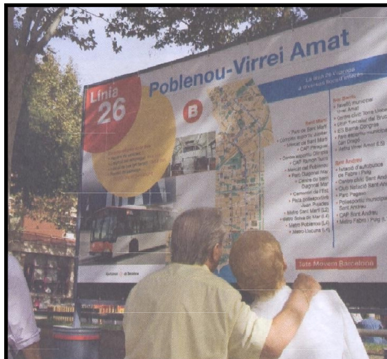
Línea 26: Está muy bien que se creen nuevas líneas, pero sería mucho mejor que indicaran correctamente su punto de inicio y final.