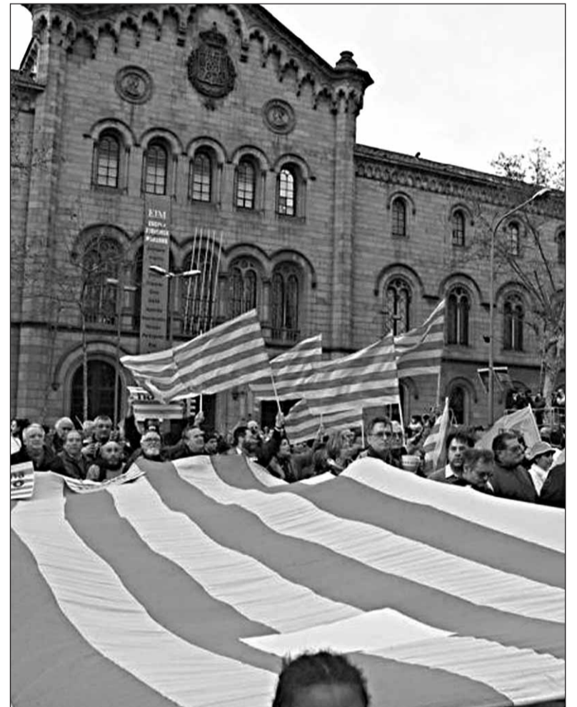
Milers de persones s'han manifestat els darrers mesos pel reconeixement de Catalunya com a nació

que treballen conjuntament en la Campanya Diguem No es va començar a visibilitzar els passats 11 i 18 de febrer, quan