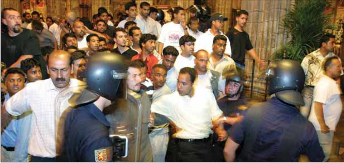
Tancada d'immigrants en defensa dels seus drets a la catedral de Barcelona