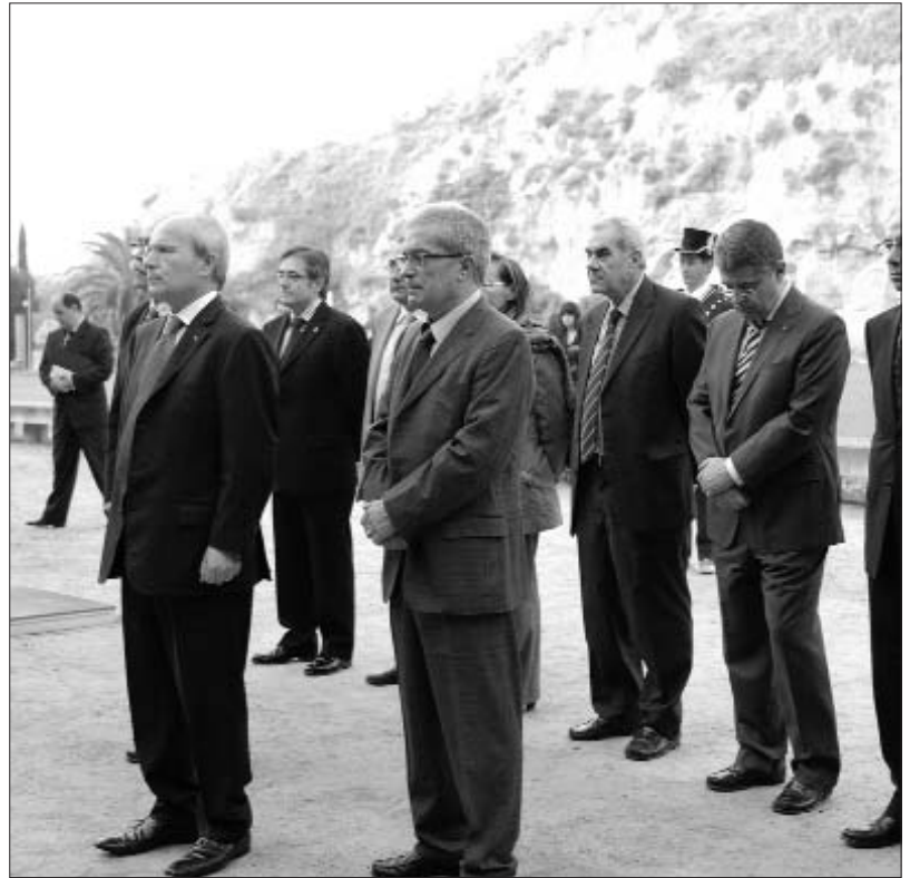
Els membres del Govern principati en una ofrena al Fossar de la Pedrera