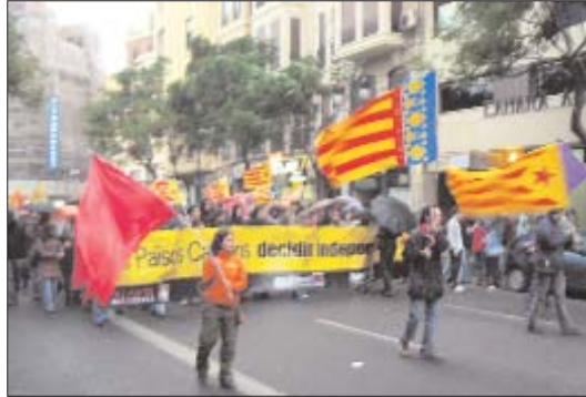
Capçalera del bloc independentista // FOTO: Francesc Francès

Si fa uns anys la convocatòria de la tradicional manifestació reivindicativa es va haver d'avançar un dia perquè la Delegació del Govern espanyol havia cedit el recorregut del dia 9 a grups d'ultradreta, enguany la manifestació ha hagut de canviar de recorregut perquè se celebrava una processó institucional que commemorava l'entrada del rei En Jaume a la ciutat. Així, la Comissió 9 d'Octubre ha hagut de traslladar el punt de partida a un carrer pròxim a la plaça de Sant Agustí, l'inici tradicional de la manifestació, i en compte de transitar pels carrers centrals de la ciutat, s'ha hagut de passar pel perímetre de Ciutat Vella per acabar a la Torres de Serrans, lluny del Parterre on hi ha l'estàtua equestre del rei Conqueridor. Tot i així, entre 1.500 i 2.000 persones acudiren a la