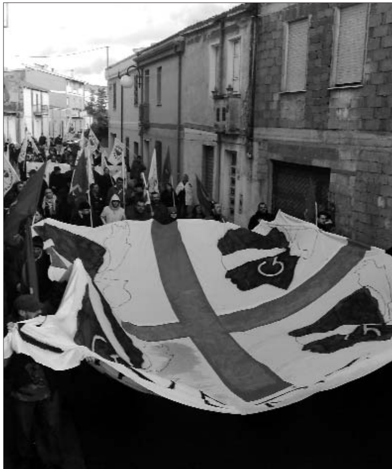
Manifestació de l'esquerra independentista sarda

l'independentisme sard ha anat en augment, i gran part de la responsabilitat la té aMPl. La seva és una feina de carrer, de lluita de base, i de moment, refusen participar a les eleccions. I això que l'any passat, IRS va aconseguir un diputat provincial a Sassari (Tàttari, en sard), un dels feus d'aMPl. Sense fer massa especulacions, és fàcilment atribuïble gran mèrit d'aquest diputat a la feina de carrer d'aMPl.