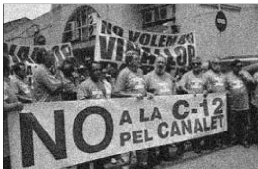
Protesta dels veïns de Vinallopp

El motiu, segons un informe de l'empresa pública Aguas de las Cuenas Mediterràneas (ACUAMED), seria l'habilitació dels pous esmentats per estar disponibles en cas d'emergència per contaminació de l'Ebre durant la neteja del pantà de Flix. L'aigua subterrània serviria per abastir el Camp de Tarragona si s'hagués d'interrompre el minitransvasament de l'aigua que s'extreu dels canals. La possibilitat que suposi un transvasament encobert preocupa a afectats, la Plataforma en Defensa de l'Ebre i la Unió de Pagesos.