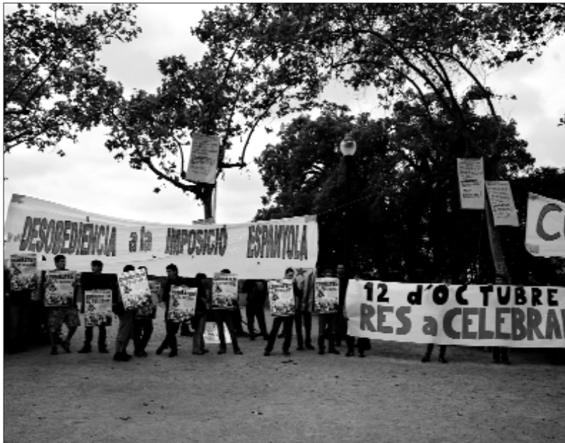
Militants independentistes es van encadenar a la plaça on es concentren els ultres

A Barcelona, la resposta contra la concentració d'homenatge a la bandera espanyola, organitzada per Democràcia Nacional, va ser convocada per l'Esquerra Independentista del Barcelonès (EIB), coordinadora que agrupa les organitzacions i casals d'aquesta ciutat. La vetlla del dia 12, una desena de militants de l'EIB es van encadenar als arbres de la plaça Sant Jordi de Montjuïc, el lloc triat pels ultres per a realitzar el seu acte polític. El dia 12, a primera hora, els Mossos d'Esqua-