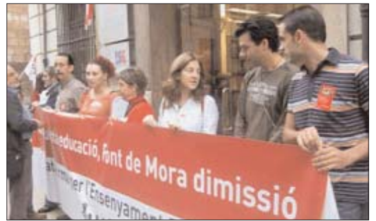
Concentració a Castelló de la Plana

De moment, però, el PP no ha sabut respondre a aquest clam generalitzat i en congrés regional celebrat el cap de setmana de 18 i 19 d'octubre han refermat la seua política educativa que es concentra en el rebuig frontal a l'assignatura Educació per a la Ciutadania. És més, la ponència marc "Sí a la vida" recull el suport dels conservadors a les iniciatives privades que "enri-