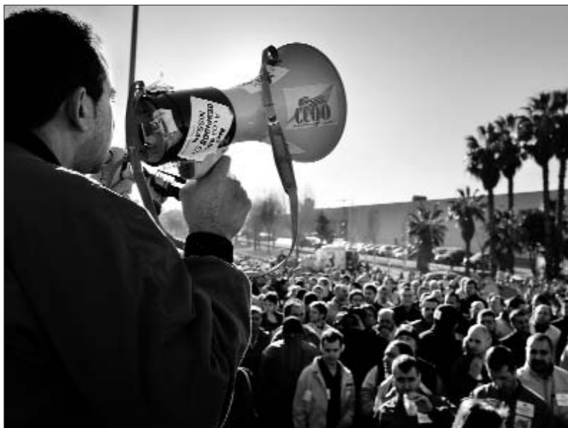
Mobilitzacions dels treballadors de Nissan de la Zona Franca

7 treballadors d'empreses proveïdores seran acomiadats per cada treballador acomiadat en una gran empresa automobilística.