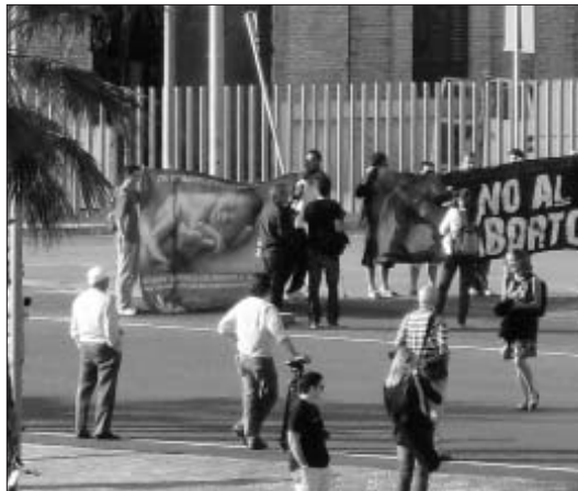
Alguns dels manifestants contraris a l'avortament

Com era de preveure, només assabentar-se de l'arribada del Women on Waves, els sectors ultracatòlics van organitzar la seua campanya d'intoxicació mediàtica, que va