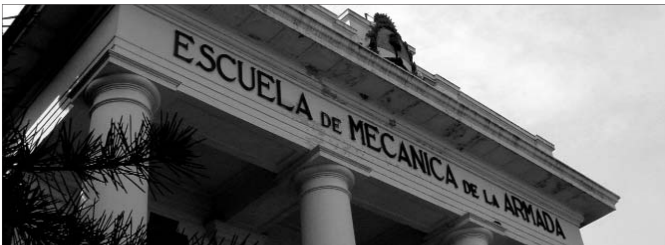
L'ESMA va ser un símbol emblemàtic de la repressió a l'Argentina