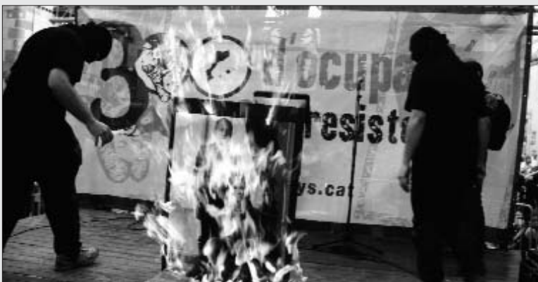
Acció el passat Onze de Setembre

Precisament, l'advocat dels 16 gironins i gironines portarà a l'Audiència Nacional espanyola el manifest dels 70 advocats dels Països Catalans per denunciar el caràcter polític del judici.