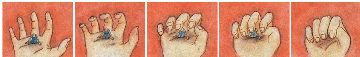
Survivors. Sheila M. Sofian

Sábados de abril, de 11:00 a 14:00 hs. / Dirigido a jóvenes de 13 a 18 años / Participación gratuita previa inscripción. Información: Servicio Pedagógico, tel. 91 774 1000 ext. 2032 / hastadiociocho.mncars@cars.mcu.es