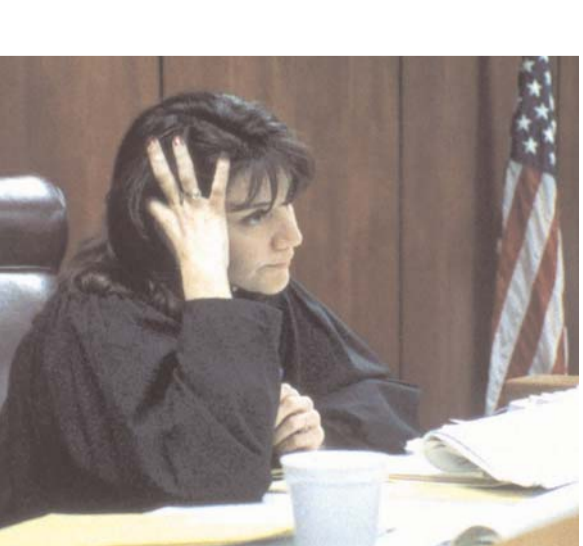
Domestic Violence 2. Frederick Wiseman

Deshaciendo nudos es una vídeo-performance de un trabajo que Beth Moysés realizó en la periferia de São Paulo con un grupo de mujeres y con la Secretaria de la Mujer. “Transportaba tallos de rosas llenos de espinas conmigo y pedía a las mujeres que pensarán en los problemas que vivían mientras arrancaban las espinas”.