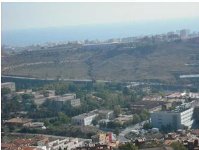
Panoràmica del parc de la Bastida

puguin organitzar, així mostrant el nostre rebuig a la especulació per la qual s'ha vist afectat la seva institució, i en conseqüència un gruix de joves que no tenen a l'abast les instal·lacions suficients com per a obtenir una bona formació esportiva dins del seu propi municipi, el qual cal esmentar es l'única ciutat amb més de 100.000 habitants sense unes instal·lacions d'atletisme reglamentàries, un motiu més per a que Joves Comunistes hagi decidit publicar aquesta injustícia.