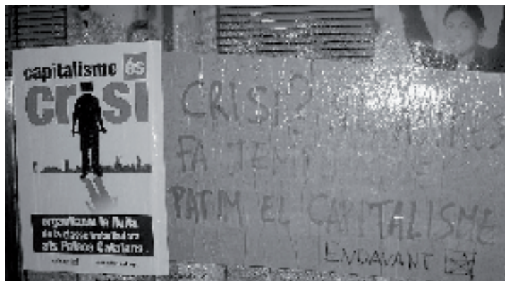
Acció a les entitats bancàries de Gran de Sant Andreu.

D'altra banda, a Sant Andreu, l'Assemblea Social de Sant Andreu tenia previst fer una assemblea oberta el dissabte 21 de febrer, que al final no es va produir per la coincidència amb el carnestoltes. L'assemblea ha estat convocada definitivament per al dissabte 21 de març, on esperen recollir les opinions de la gent i mirar d'aglutinar esforços contra la crisi. A part, també tenen prevista una cafeta d'autogestió per al dissabte següent, 28 de març, al CSO La Gordíssima, per a l'autogestió de l'Assemblea. La data coincideix amb una jornada de lluita unitària contra el G-20, ja que aquell mateix dia hi ha reunió d'aquest poderós grup