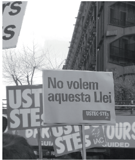
Manifestació per l'educació pública.