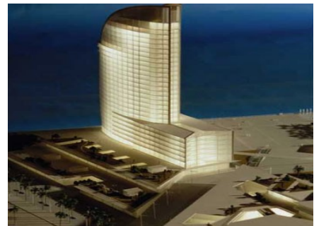
maqueta del Hotel Vela de Ricardo Bofill promovido por la Autoritat Portuària

Ante esta preocupación, la avv l'òstia se ha puesto en contacto con un miembro de ACIB (asociación de comerciantes) y le ha propuesto que se haga una tarjeta para los vecinos empadronados, para que puedan tener descuento a la hora de comprar productos básicos. La idea es promover una "tarjeta de barrio" con la que la gente de aquí pueda tener un descuento en las tiendas, bares... Para eso, también se le ha pedido al distrito que subvencione a los comerciantes que se animen a unirse. En breve empezaremos a recoger firmas para que esta iniciativa se vuelva realidad, así que estate atenta (y si tienes un comercio, no dudes en hacernos llegar las dudas y opiniones que tengas sobre esta idea)