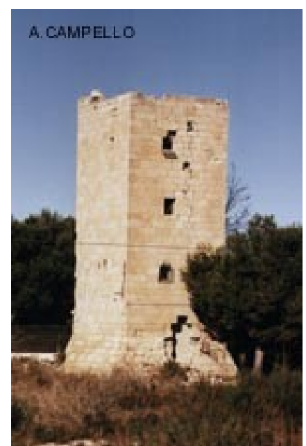
Torre del Xiprer, abandonada, expoliada i completament deteriorada

La història, les gents, i la seua activitat ha generat a l'Horta d'Alacant una arquitectura característica, com són les grans cases que es troben apegades a la carretera de València, i que totes les alacantines hem admirat una vegada o altra, malgrat el deteriorament i l'abandó de moltes d'elles. També, com hem dit abans, a l'Horta van nèixer les torres. Poques alacantines saben de la seua existència, ja que la desmemòria és una característica pròpia, ben fomentada per les autoritats municipals que només veuen en l'Horta un terreny on especular i construir apartaments enlloc d'un espai verd, agrícola i històric a conservar.