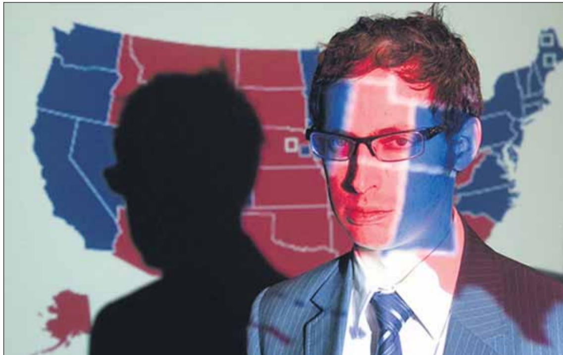
Nate Silver va ser l'únic capaç de predir la victòria d'Obama sobre Clinton a Carolina del Nord en les primàries

Silver, nascut fa 30 anys a Chicago, llicenciat en Econòmiques, i aficionat al beisbol i a les matemàtiques des de ben petit, ja es va fer conegut per haver revolucionat el món de les prediccions esportives quan va crear el PECOTA ( Player Empirical Comparison and Optimization Test Algorithm ). Es tractava d'un mètode estadístic per predir els resultats de la lliga de beisbol que li va permetre obtenir uns espectaculars resultats després de publicar-se l'any 2003. El sistema, basat en l'estudi matemàtic de les trajectòries dels jugadors comparant-les amb jugadors anteriors amb característiques i estadístiques semblants, permetia preveure uns resultats amb una determinada distribució de probabilitat i un marge de confiança.