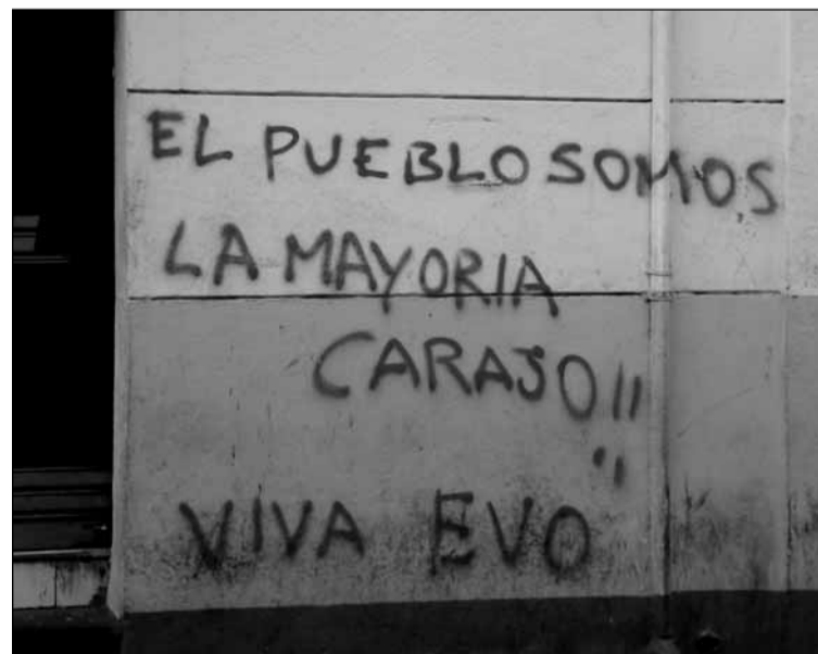
El poble està amb Evo, la pintada ho deixa ben clar