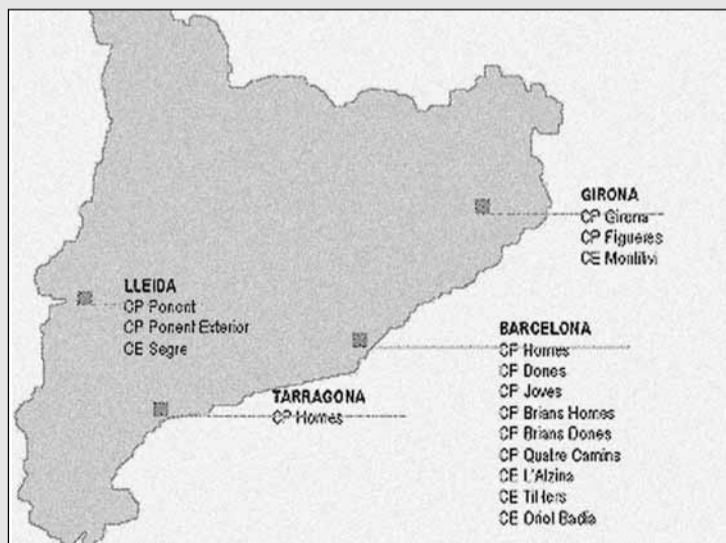
Tallers del CIRE a les presons del Principat

Cal tenir en compte a més que als treballadors presos no se'ls aplica cap conveni col·lectiu, ni tenen reconeguts els drets d'associació i vaga, i els seus "contractes de treball" verbals poden ser modificats unilateralment per l'empresa o el CIRE. Finalment, les cotitzacions empresarials a la Seguretat Social per a les pensions de jubilació o invalidesa són ridícules.