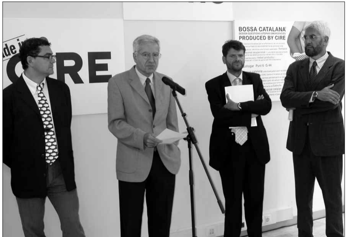
Inauguració de les instal·lacions del CIRE al barri de Gràcia el 2004

"Claved SA mantenia treballant quaranta dones empresonades mentre presentava un ERO per acomiadar 34 treballadors de la factoria"