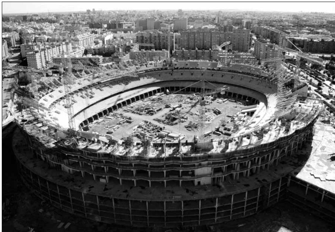
Les obres del nou Mestalla han portat a la crisi institucional i econòmica que travessa el València CF