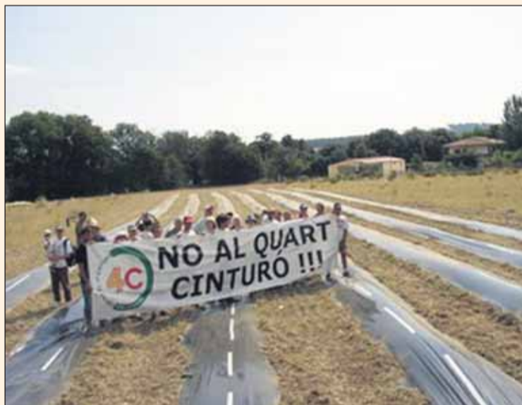
Mobilització contra la construcció del Quart Cinturó al Vallès

La campanya va recalcar que el Quart Cinturó no suposa cap replantejament dels peatges, sinó el manteniment de peatges metropolitanos interns i asimètricament situats, la qual cosa és una excepció en el conjunt espanyol i europeu. A més, suposa el manteniment d'un bypass costós i inadequat per a la regió. Segons es va apuntar, els costos energètics de circular entre Martorell i La Roca tripliquen el seu valor entre el Quart Cinturó respecte de l'AP-7, siga quina siga la tecnologia del vehicle. Una altra qüestió capital és que els espais agronaturalment més ben conservats del Vallès són al terç nord de la plana, just per on es vol fer passar el Quart Cinturó. Tanmateix, els flu-