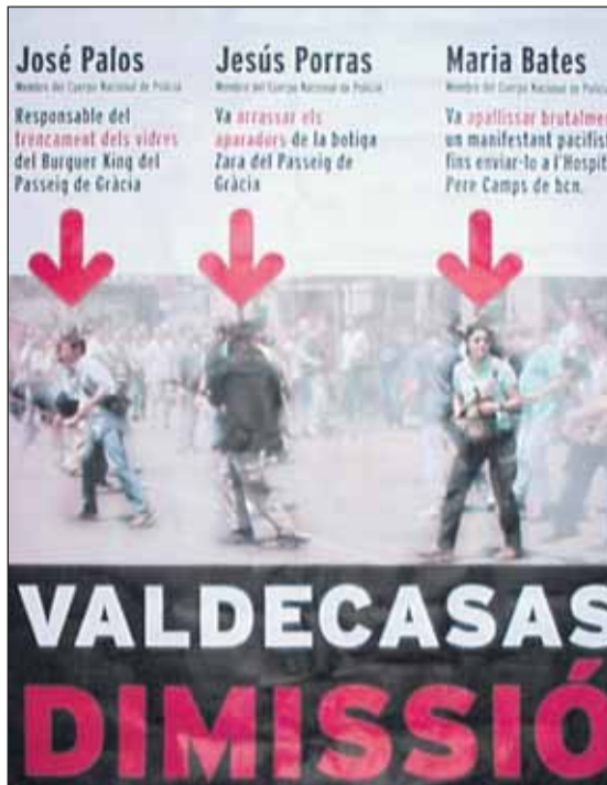
Cartell contra els policies de paísà el juny de 2001 a Barcelona

Un dels moviments que va patir la contundència dels agents policials al servei de Valdecasas va ser el moviment