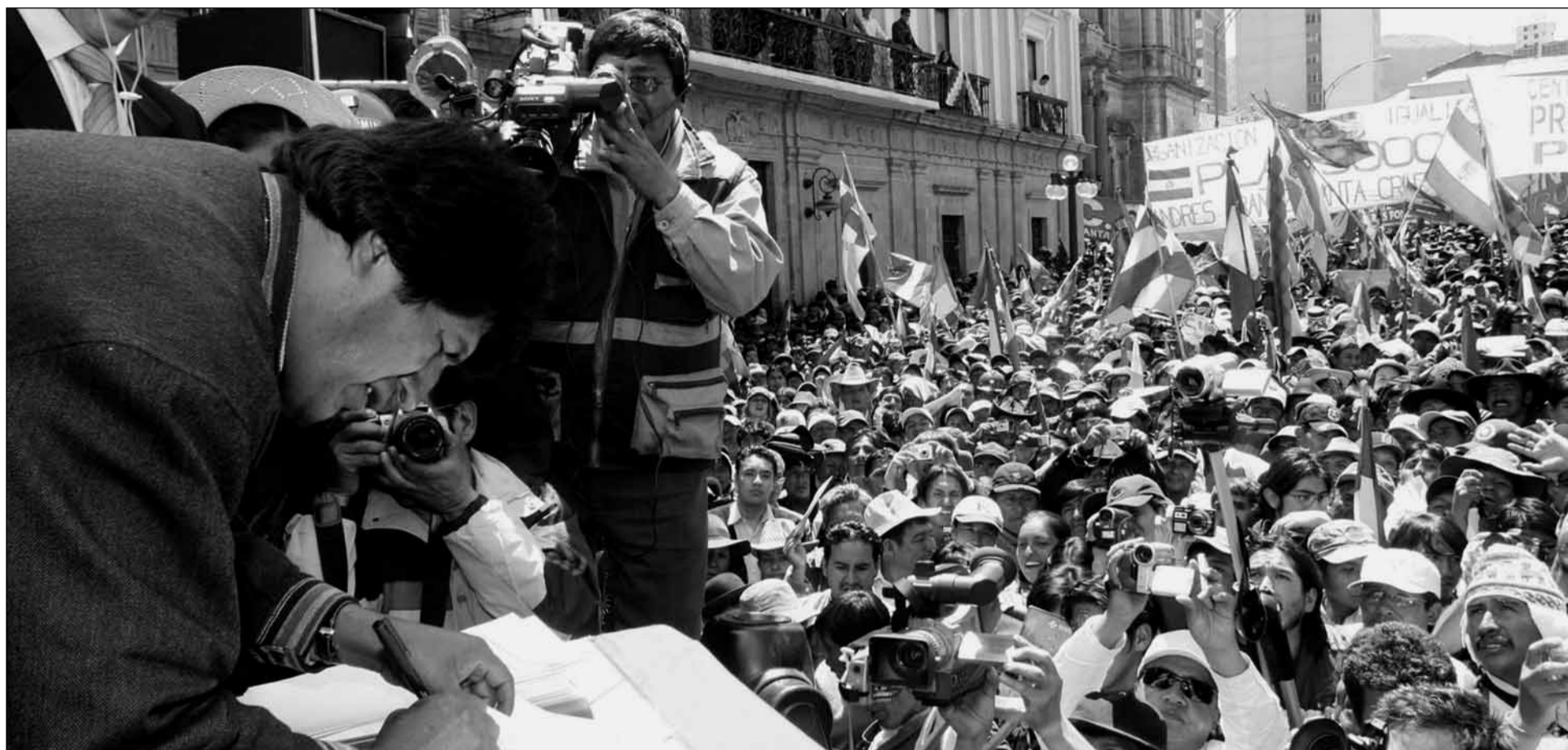
La Constitució impulsada per Evo Morales tirà endavant