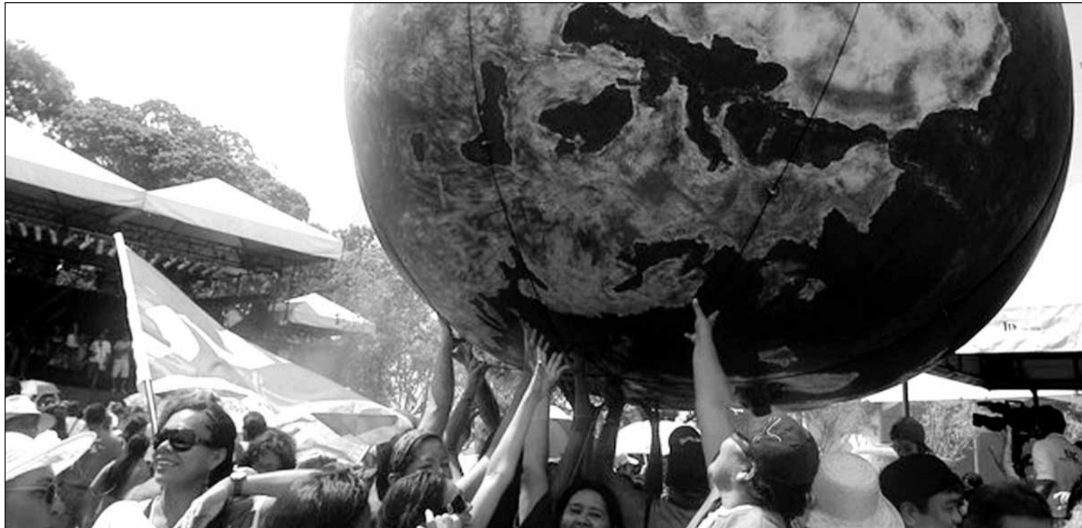
Les alternatives al model capitalista reben impuls al Fòrum Social Mundial

El Fòrum Social Mundial va sorgir com a espai de trobada dels moviments socials d'arreu del món, plurals i diversos, en una època d'aprofundiment de les estructures de dominació de l'imperi i d'afebliment de la consistència de les alternatives que s'hi contraposaven. Seguint l'explosió de ràbia de les contracimeres de Seattle, Praga o Gènova, alhora que madurant els principis polítics que l'Exèrcit Zapatista havia sabut proclamar des de Chiapas, el Fòrum ha sabut situar al centre de l'alternativa a la globalització el concepte de diversitat. Front a la homegeneïtzació cultural i política que necessita l'Imperi per aprofundir el domini del capital, el Fòrum hi ha sabut aportar la diversitat dels pobles, les propostes i les persones per generar un marc propi i humà de generació d'alternatives.