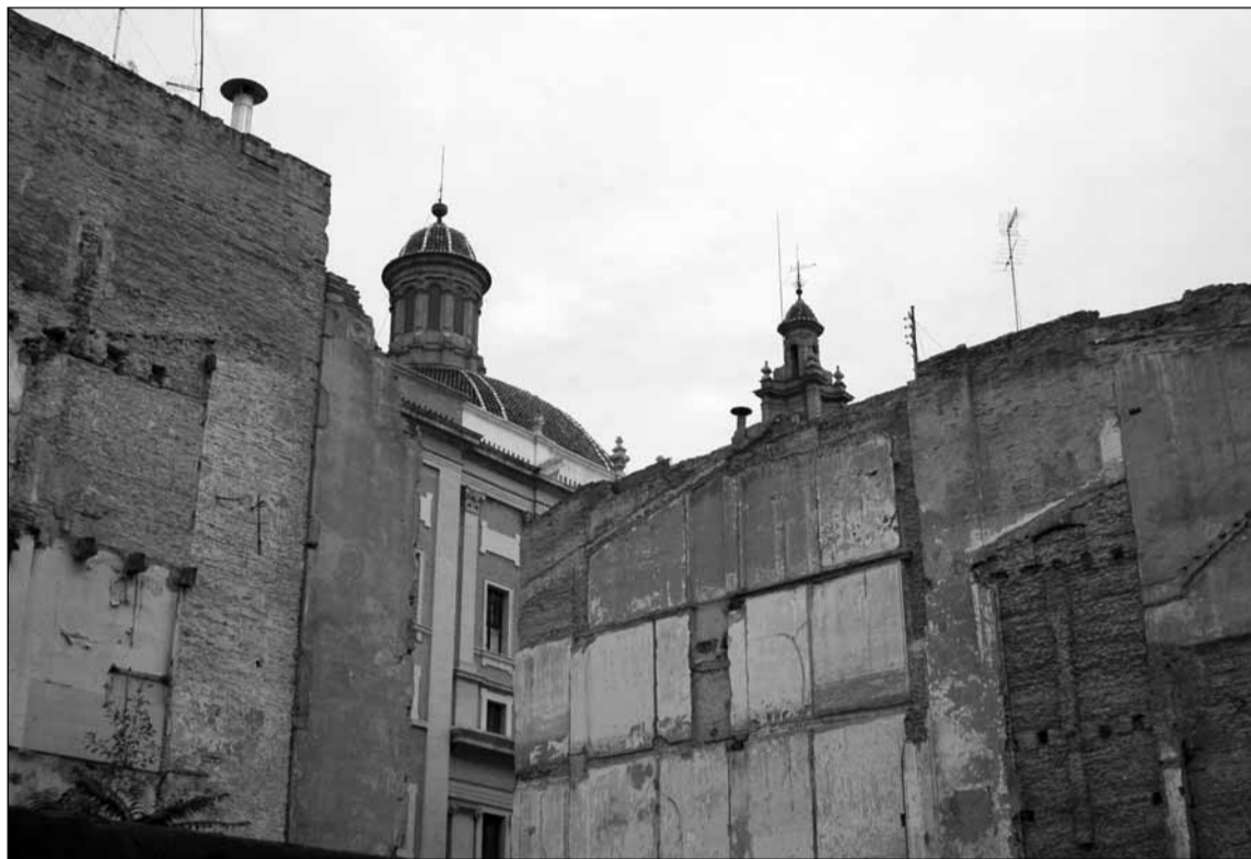
A Velluters s'hi barregen nombrosos monuments amb solars i cases en runes

Imagina Velluters és un concurs d'idees convocat per l'Agrupació Sostre Arquitectes per l'Habitabilitat Bàsica, la Cooperació i el Desenvolupament Sostenible, i l'Agrupació d'Arquitectes pel Paisatge, en coordinació amb la Plataforma Recuperem el Princesa, reviscolem el barri (de la qual forma part Endavant-OSAN). L'objectiu del concurs no és altre que presentar propostes que revitalitzen el barri mitjançant inter-