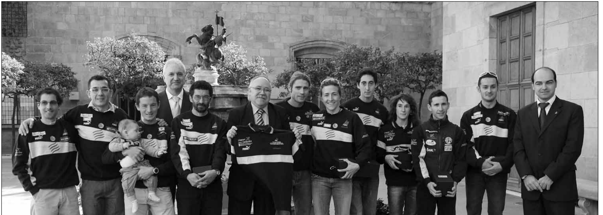
Membres de la selecció en una recepció oficial al Palau de la Generalitat principatina, el novembre de l'any passat