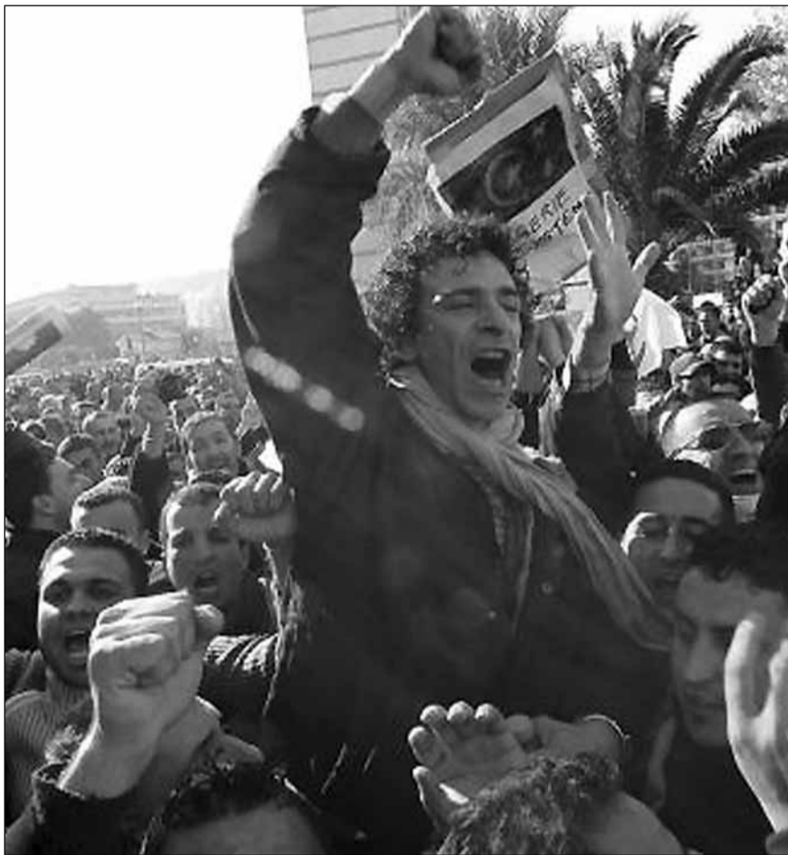
Algèria, juntament amb Líbia, és l'escenari de les principals revoltes

Aquest cop d'estat va donar inici a una veritable guerra civil entre islamistes i