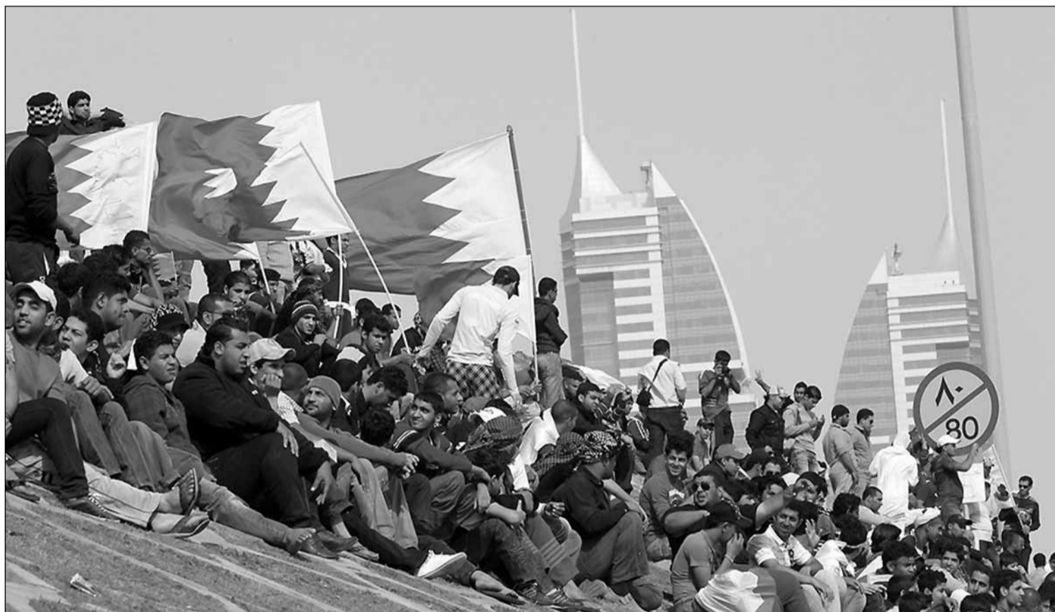
Les protestes a Bahrain amenacen la influència dels Estats Units d'Amèrica a la zona

La declaració d'independència de Bahrain significà el reforçament de la família reial Al Jalifa, assumint un dels seus membres el títol d'emir, i la convocatòria d'eleccions per escollir una Assemblea nacional que tingua una vida efímera, poc més d'un any, per la decisió de la família reial de clausurar-la. A partir d'aquest moment, Bahrain s'anà configurant com una monarquia tirànica, corrup-