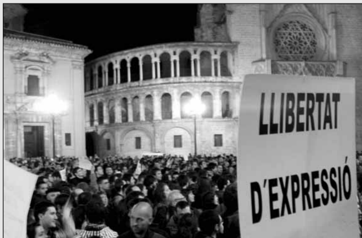
La plaça de la Mare de Déu de València es va omplir el dilluns 21

Els assistents mostraren la seua indignació per la decisió del Govern valencià i per la complicitat de l'espanyol amb nombrosos plafons a favor de TV3 i també amb pancartes reclamant la llibertat d'expressió. En eixe sentit, foren especialment explícits els col·lectius de l'esquerra independentista, que feren palès que la censura de TV3 és un atac a la cultura catalana i al conjunt de la nació. El SEPC desplegà una pancarta amb el lema "Sí a la cultura, no a la censura. Llibertat d'informació és llibertat d'expressió," mentre que Endavant mostrà el lema "Llibertat d'expressió als Països Catalans". Altres col·lectius, com Ca Revolta també foren presents amb pancarta pròpia i amb nombrosos plafons per