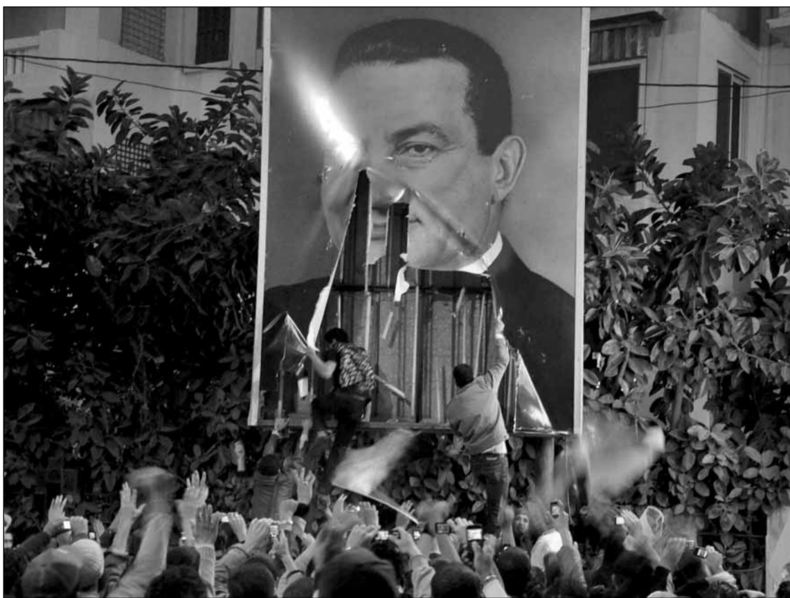
Mobilitzacions a Lleida l'estiu passat en favor de la vaga general

L'essència de la narrativa israeliana és simple: es tracta d'una revolució iraniana -amb l'ajuda d'Al Jazeera i estúpidament permesa pel president desl' EUA Barack Obama, que és un nou Jimmy Carter, i per un món estupefacte-. Punta de llança de la interpretació d'Israel són els ex ambaixadors d'Israel a Egipte. Tota la seva frustració d'estar tancats en un pis elevat al Caire ha entrat en erupció com un volcà imparable. La seva diatriba es pot resumir en les paraules d'un d'ells, Zvi Mazaal dites al Canal 1 de la televisió israeliana el 28 de gener, "això és dolent per als jueus, molt dolent."