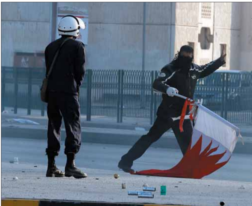
El minúscul emirat de Bahrain està vivint dies convulsos lluny dels luxes de la Fòrmula 1