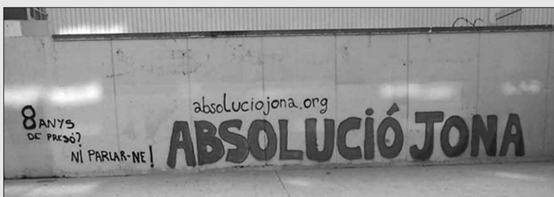
Les mostres de suport s'han reproduït arreu del territori