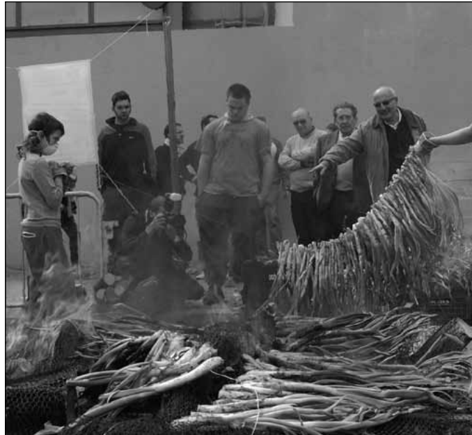
Imatge de la III Calçotada Popular, l'any 2008

Durant aquesta V Calçotada, a més, es vol remarcar un fet molt concret: que aquest escenari de festa i lluita té lloc cada any en el mateix espai públic: al carrer. La calçotada esdevé així un escenari de recuperació de l'espai públic,