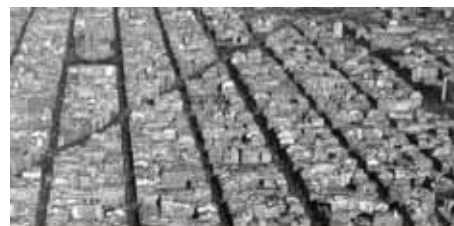
L'Eixample Nord tindrà Casal Independentista