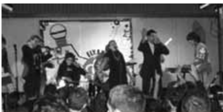
EixampleSONA: el festival de la música jove

Cas Jona: un any més lluïtant per la seva absolució