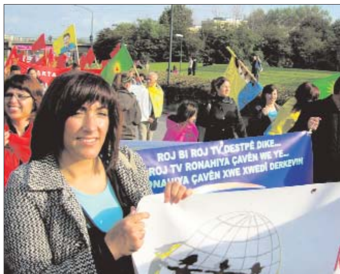
El Fòrum Social Europeu s'ha fet ressò de la crisi i la creixent precarització

Crisi hipotecària L'article analitza les causes que han derivat en l'actual crisi financera. A l'Estat espanyol, el sector immobiliari hi ha jugat un paper central, que per entendre cal remuntar a l'etapa del ministre Boyer.