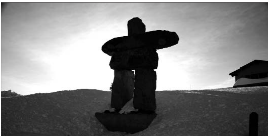
Símbol típic dels inuits que tradicionalment s'usava com a marca per a la navegació

D'aquesta manera, la monarquia danesa aplicà a Grenlàndia, fins ben passada la segona meitat del segle XX, una estricta política colonial fonamentada en el control absolut del comerç exterior, de l'educació, de l'economia productiva i de l'aculturació a través de moviments forçats de població i de l'arribada de pobladors danesos. La "modernització" forçosa a la que fou sotmès el poble inuit per part de la metròpoli ha provocat un traslocament profund de les referències culturals i vitals dels inuits, ja que, com ha assenyalat l'historiador i urbanista Mike Davis, l'estratègia colonial de concentrar la població autòctona de desenes de pobles a grans centres urbans de fàbriques conserveres ha produït una societat amb un alt grau de desestructuració agreujada per l'economia política de les bases militars nord-americanes presents a l'illa.