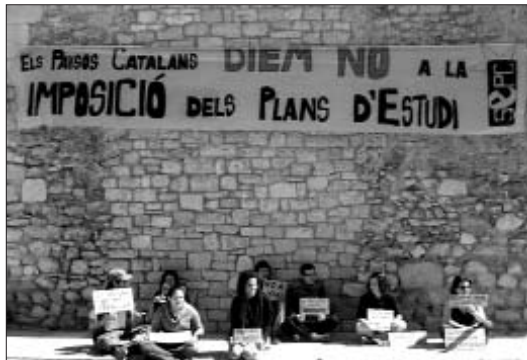
Acció contra els nous plans d'estudi al Universitat de Girona

En altres universitats dels Països Catalans ja han dut a terme aquesta iniciativa al llarg del curs passat, com la facultat d'Història de