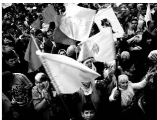
Kurds de Turquia celebren el Newroz

Les demandes dels que s'han sumat a la vaga de fam són el reconeixement de la seva identitat política i civil com a presos; la cancel·lació de les condemnes a mort pels activis-