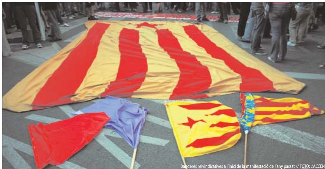
Banderes reivindicatives a l'inici de la manifestació de l'any passat

La tradicional manifestació reivindicativa de la vesprada del Nou d'Octubre a València s'ha vist obligada a canviar el recorregut per primer cop en molts anys. Mentre que l'Ajuntament concentra més i més actes "culturals" al centre de València per impedir el pas dels manifestants, la Delegació de Govern espanyola ha cedit al grupscle GAV part del recorregut tradicional de la marxa nacionalista.