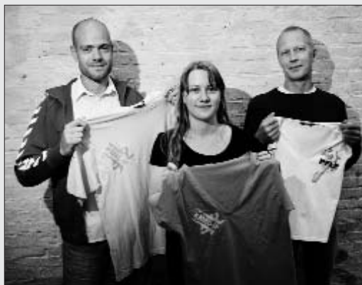
Les samarretes de Fighters & Lovers amb les sigles de FARC-EP