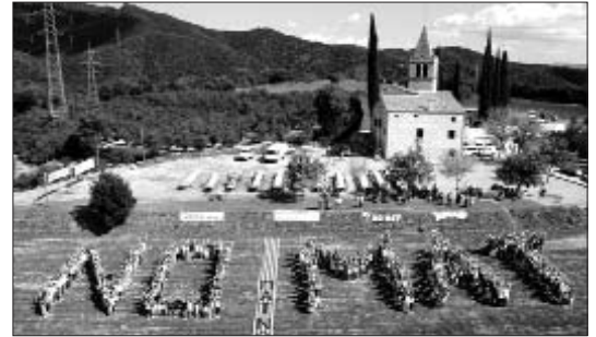
Mobilització contra el MAT a Bescanó, l'any passat

Tot i l'afany d'obstaculitzar el moviment ciutadà en contra de la MAT, el passat 24 de setembre, la Plataforma i l'Associació de Municipis contra la MAT (AMMAT) van presentar dues demandes davant del Tribunal Suprem espan-