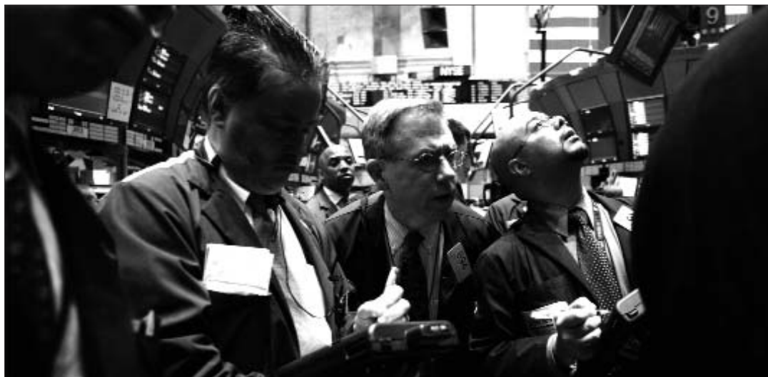
Brokers de Wall Street pendents de les cotitzacions

Va ser l'abundància de capital que va impulsar les entitats financeres a concedir hipoteques amb molta facilitat, però sota una forma diferent als Estats Units. En el