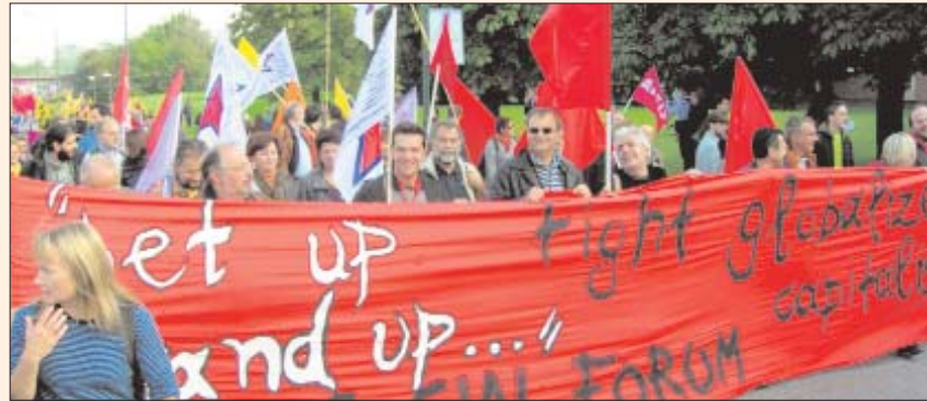
Pancarta durant la manifestació del Fòrum Social Europeu

El problema és que aquest pla B ha fracassat. A curt termini, la UE podria continuar funcionant amb el Tractat de Niça i amb decisions normatives -directives, reglaments, sentències del Tribunal de