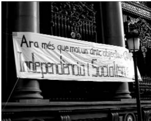
Pancarta de la CAJEI en el recorregut de manifestació del 25 d'abril d'enguany

Això s'ha adobat amb la intensificació de les pressions per part de l'extrema dreta, que han passat de la simple provocació a temptatives més organitzades d'aturar la mobilització. Així, el 2005 els partits ultrs s'avançaven a la Comissió 9 d'Octubre (formada per diversos partits i associacions de l'espectre nacionalista) i demanaven el tradicional recorregut de la Diada; fet que va fer que es convocaren dues mobilitzacions amb presència independentista: el 8 i el 9 d'Octubre. L'any passat els blavers es concentraren al Parterre-lloc de cloenda de la mobilització independentista- i, protegits per la poli-