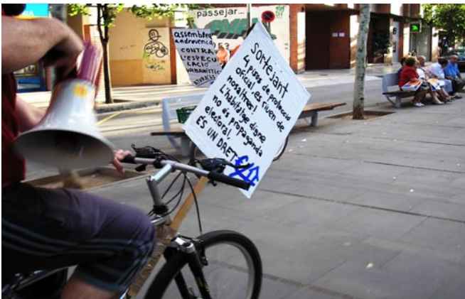
Pas de la bicicletada pel Psg. Onze de Setembre.