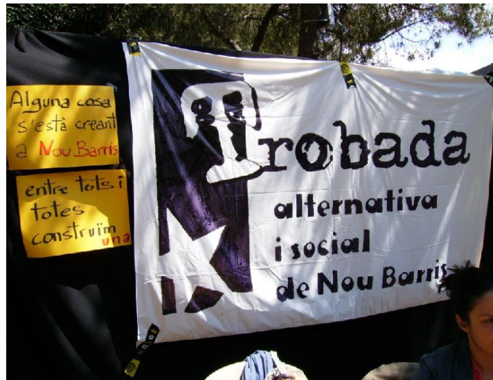
La Trobada va ser present a la “Cultura va de Festa”.

escletxa per poder començar a esquinçar aquest sistema. Podeu trobar més informació a www.trobada9barris.blogspot.com