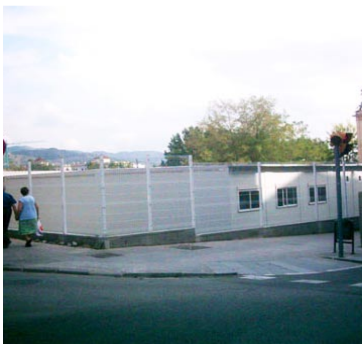
Barracons del CEIP Eulàlia Bota.

La resposta del Consorci d'Educació de Barcelona, l'organisme públic responsable de l'educació a Barcelona, ha estat que, per una banda, s'obriran 25 places escolars més al col·legi