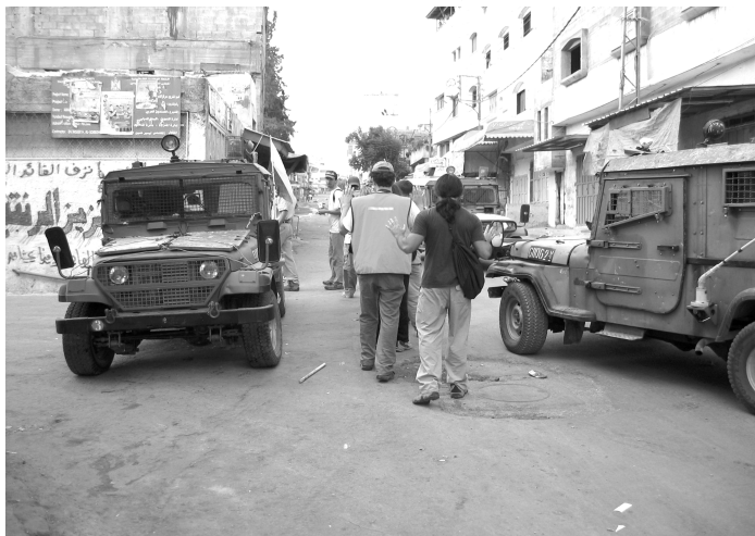
Rompuda de toc de queda al camp de refugiats de Tulkarem

En el temps que els soldats les deixen tranquil·les, les cisjordanes fan una vida el