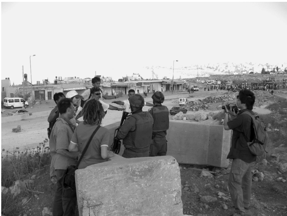
Impedint el treball dels soldats

Han passat dos anys. A les notícies és el torn del Líban i del nord d'Israel. Gaza sempre present. Però no oblidem. Mentre tots tenim els ulls desviats, a Cisjordània continuen colpejant. La quotidianitat no és notícia. A mi els records em demanen tornar.