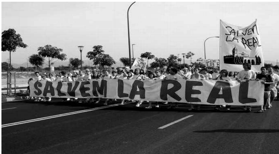
Manifestació de la plataforma Salvem La Real.