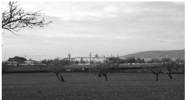
Paisatge de La Real amenaçat de mort.