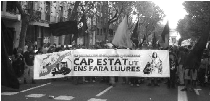
Participació del Bloc Negre a la manifestació de l'11 de setembre de 2005.

Hi ha altres col·lectius, com Katarko (Prat del Llobregat), i individualitats amb els que estem treballant per impulsar una xarxa fruit de la qual ha nascut la revista "La Rosa dels Vents", publicació oberta a col·laboracions perquè esdevingui en una eina pel debat llibertari als PPCC.