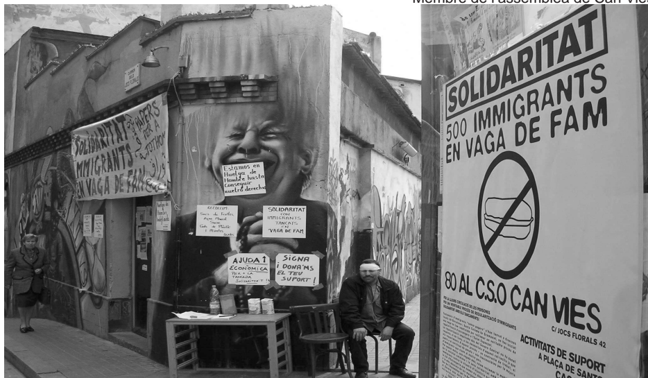
Façana del CSA Can Vies