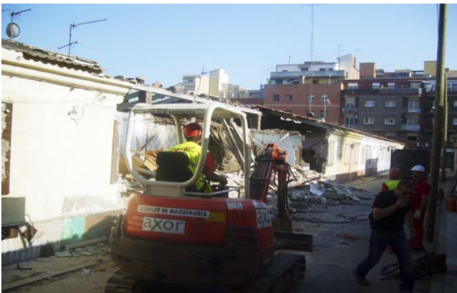
Foto de l'enderroc.