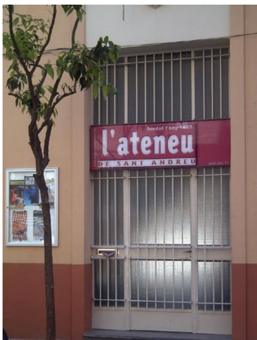
Façana actual de l'Ateneu.

No fou fins a principis dels anys 80 que antics membres de l'Ateneu varen poder recuperar, en cessió, els antics locals del carrer Abat Odó, propietat de l'Ajuntament de Barcelona.