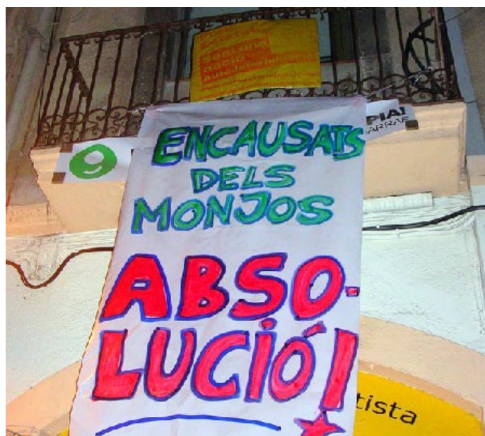
Pancarta de protesta

Els joves denuncien que el seu és un cas més en què es palesa que no s'han modificat els pilars bàsics de l'Estat espanyol, molts d'ells hereus del franquisme (tortures, repressió política, feixisme...).