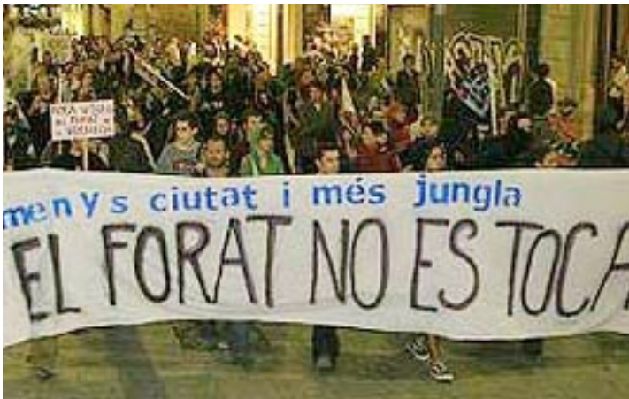
Manifestació 5 d'octubre