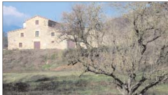
Can Riera està afectat per un ARE

Sembla que no es vol repetir el model urbanístic horitzontal que tan s'ha desenvolupat les dues darreres dècades. Per aquest motiu els directius del Pla territorial es basen en creixements compactes, d'alta densitat i en continuïtat a la ciutat existent. En aquesta línia es poden incloure les ARE que, poden convertir espais en sòl urbanitzable per a la via d'urgència amb un mínim d'un 50% d'habitatge protegit. Des de Política Territorial es pretén tirar endavant 100 ARE en 86 municipis que suposaran més de 90.000 nous pisos abans del 2011. Aquesta seria un dels camins per cobrir el creixement que proposa el PTP: 456.000 habitatges