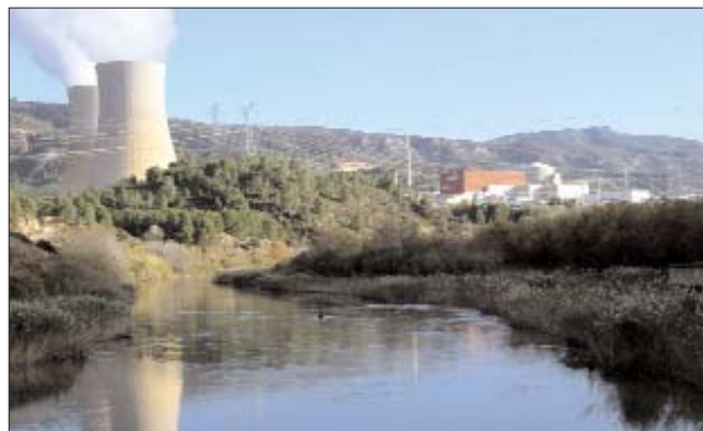
La central nuclear d'Ascó ha sigut notícia per una fuga radioactiva

Les Terres de l'Ebre estan en peu de guerra. La proposta d'interconnexió de xarxes per tal d'abastir a la Regió Metropolitana de Barcelona és percebuda com una traïció dels partits que el 2003 van firmar el denominat Compromís de l'Ebre. De manera paral·lela, i enmig de la confusió del cas de la fuga de partícules radioactives de la central nuclear d'Ascó, l'empresa pública ENRESA ha iniciat els tràmits per instal·lar-hi un magatzem de residus nuclears. Aquesta decisió podria servir per allargar la vida de la planta deu anys més.