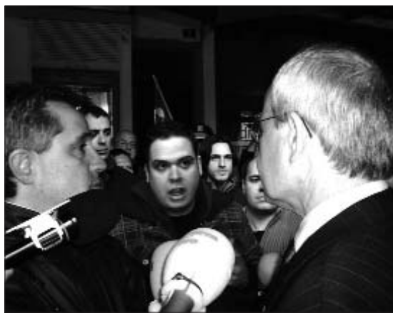
Montilla diu que està tranquil però els treballadors de Comforsa no tant

Enmig d'aquesta situació desastrosa hi ha una excepció. Es tracta de l'empresa Comercial de la Forja (Comforsa) producte de la unió de les fargues Casanova i Taga a partir d'un pla de reactivació engegat per la Generalitat. D'aquesta manera en pocs anys es va aconseguir salvar aquestes factories de la fallida i es va constituir un grup potent que ha passat d'ocupar menys de 200 treballadors a 450 de manera directa i dos centenars més de manera indirecta en les seves plantes de Ripoll i Campdevànol. Cal tenir en compte que la població comarcal és oficialment de 26.500 persones tot i que es calcula que entre dos i tres mil corresponen a propietaris de