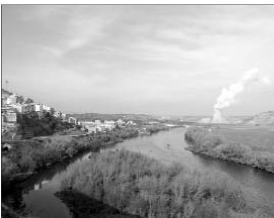
Ascó, amb la central nuclear de fons

* Informació elaborada a partir del Grup de Científics i Tècnics per un Futur No Nuclear (GCTFNN)