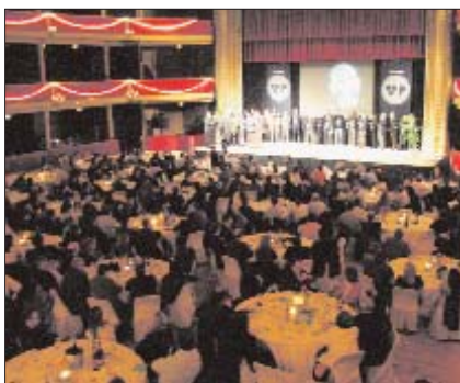
Acte a favor de la Vegueria

Aquesta carretera segueix apareixent en el pla territorial però dividida per parts i amb una altra nomenclatura. Aquest és el punt de vista d'entitats com l'Associació per a la Defensa i l'Estudi de la Natura (ADENC), que consideren que, malgrat el canvi de nom, el projecte segueix sent el mateix. Concretament, el nou nom del Quart Cinturó en el seu pas entre Vilafranca del Penedès i Abrera (el Baix Llobregat) és Eix Central del Penedès, el tram que transcorre entre Granollers i Sant Celoni pren el nom de C-35 i entre Abrera i la Roca passa a anomenar-se Ronda del Vallès. Per altra banda es complementa amb dos ramals més: al sud el desdoblament de la C-15 entre Vilafranca i Vila-