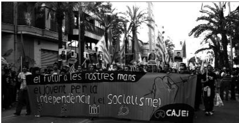
La CAJEI va encapçalat el bloc de l'esquerra independentista a la manifestació d'Alacant

Més de quinze mil persones participaren a la manifestació que, enguany, es va traslladar dels carrers de València als d'Alacant. Les organitzacions de l'esquerra independentista van fer un important desplegament humà amb els blocs més nombrosos i un gran nombre d'accions al llarg de tot el recorregut.