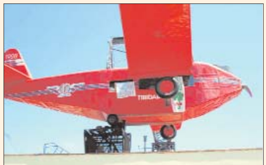
"Segrest" de l'avió del Tibidabo