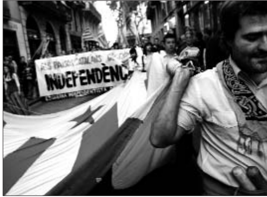
Capçalera de la manifestació pels carrers de Barcelona