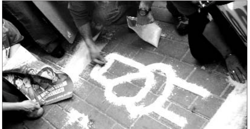
Acció de la Plataforma en Defensa de l'Ebre a les portes de la Delegació del Govern

A més, entre els recels que hi ha a l'Ebre cap a les dades que facilita el Govern, tampoc confien en els terminis sobre l'execució de l'obra: "Nosaltres pensem que no tindran temps per acabar la canonada en sis mesos. I és que encara no saben ni qui la farà, ni per on passarà, ni han començat el procés d'expropiacions, ni han fet l'estu-