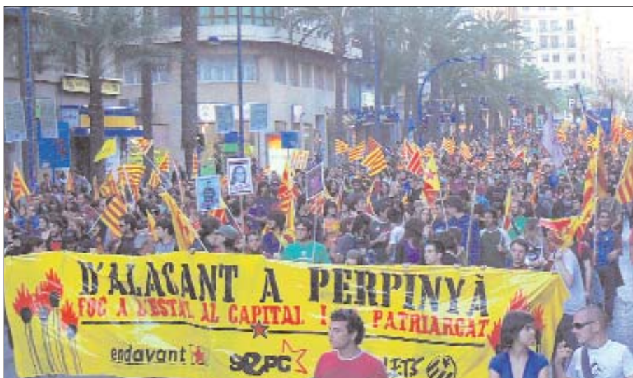
Bloc d'Endavant, Maulets i el SEPC a la manifestació del passat 26 d'abril