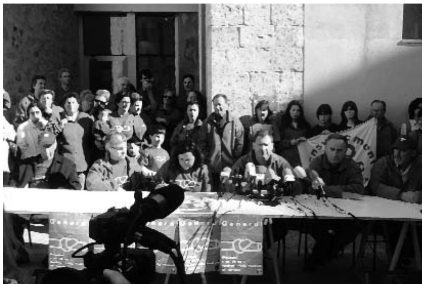
El debat sobre l'aigua respon també al debat sobre el model territorial de desenvolupament

En tot aquest procés hi ha una concentració d'activitats econòmiques amb important valor afegit a la capital, mentre les comarques van perdre demografia i pes econòmic gràcies a una globalització que importa el que al segle XIX trobava a les comarques interiors (especialment productes alimentaris). Tanmateix, hi ha tres elements que posen de manifest la importància actual de les successives corones del voltant