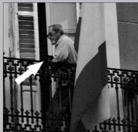
El fotògraf de L'ACCENT capturarà l'escena