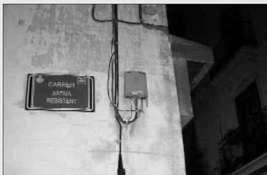
Canvi de noms de carrers a València ciutat

Per al dia 25, la coordinadora de la Campanya a l'Horta, que integra les organitzacions Endavant, Maulets, CAJEI, SEPC i Alerta Solidària, va convocar una manifestació pel centre de València. Durant el recorregut de la marxa, que va reunir vora tres-centes persones es van fer diverses accions en favor de la territorialitat dels Països Catalans i contra la repressió espanyola i francesa. Una de les accions va consistir en la cre-