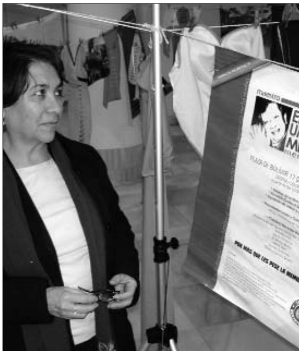
Abella observa el cartell que commemora el desè aniversari de l'assassinat d'un advocat

Prop del 35% del Congrés estaria a sou dels paramilitars, si és cert el que han reconegut els seus propis líders. Cada dia hi ha detencions de polítics. Fins i tot alguns congressistes han renunciat a la seva acta per no ser investigats. Són els aliats del president Uribe els que estan sent investigats per relacions amb els paramilitars i el narcotràfic. Ara mateix la Cort Suprema té cer-