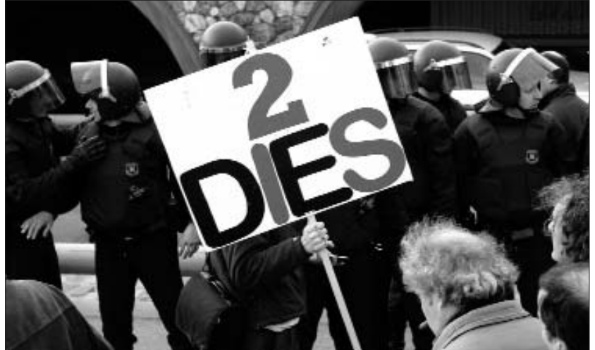
Els treballadors i les treballadores de TMB s'han hagut d'enfrontar als cossos repressius en diverses ocasions

Com a conseqüència de l'acord, 30 treballadors expedientats però sense una sanció efectiva se'ls ha retirat de manera directa l'expedient. D'altra banda, a 24 treballadors amb una sanció en curs se'ls paralitza i se'ls treu l'expedient, però assumeixen els dies que ja els