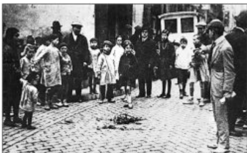
Un grup de persones davant les flors dipositades al lloc on va morir assassinat El Noi del Sucre, el 1923, al carrer de la Cadena.