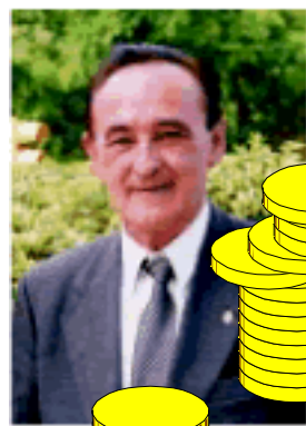
Lorenzo Palacín Badorrey Alcalde d'Esplugues

Això anul·la l'esperit urbanístic de fer d'aquesta zona una entrada al Parc de Collserola i canvia l'impacte de les torres elèctriques per un impacte molt superior al deixar fer edificis amb alçades que oscil·len entre 28 i 90 metres.