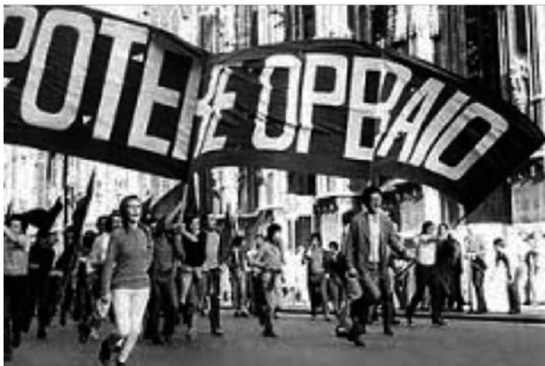
Potere Operaio (“Poder Obrer”) va sentar, entre els 60 i els 70 a Itàlia, les bases de l’anomenada “autonomia obrera”.