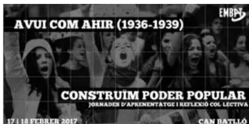
Cartell d'Embat (Organització Llibertària de Catalunya) que són els anarquistes catalans promotors del "Poder Popular".