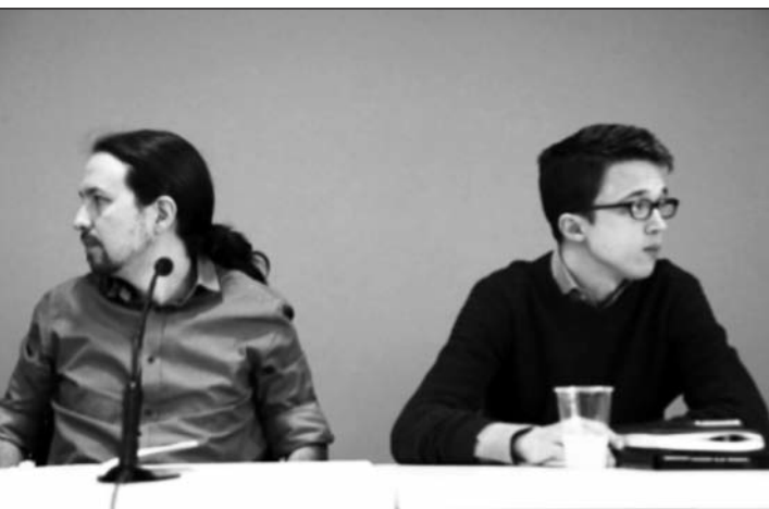
La consigna "Poder Popular" està al centre de la polèmica entre "pablistes" i "errejionistes" de Podemos. Els primers la defensen, els segons la rebutjen.

lar" ha d'acabar substituint al poder burgès i capitalista, s'afirma que el "poder popular" s'entén acceptant que el subjecte de canvi és la classe treballadora i també es diu que el fet que el control de l'educació el tingui l'Estat "ens aboca a la lluita institucional i no al poder popular." 8