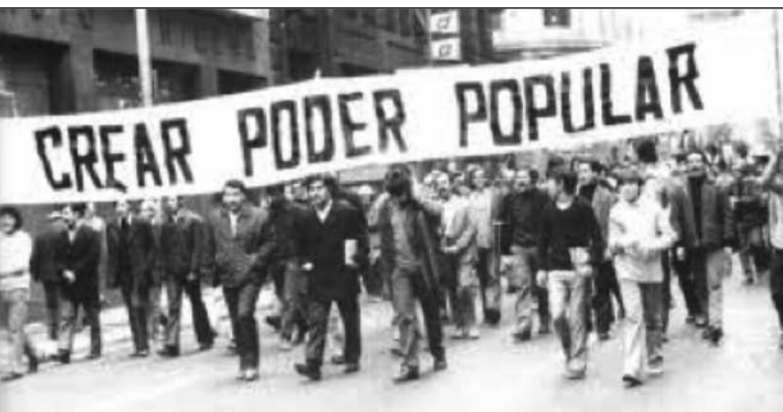
La consigna "Poder Popular" té el seu origen entre l'esquerra xilena dels anys 70 amb diferents interpretacions.

litzaven com la petita burgesia s'havia anat enquadrant dins de la "Unidad Popular" (a qui disputaven la conducció del procés).