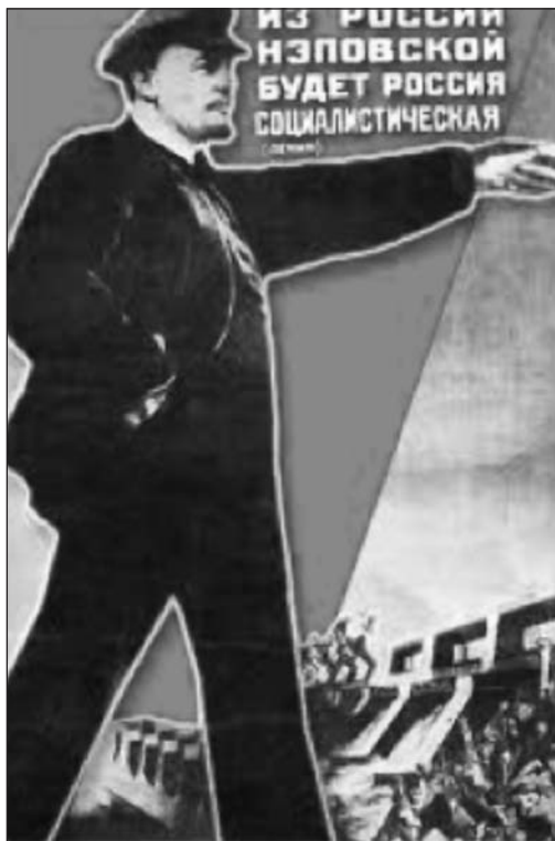
“El Capitalisme al servei del Comunisme” (cartell propagandístic de la NEP de Lenin) l’hem relacionat actualment amb la idea d’un “Poder Popular” amb un paper capdavanter de la classe treballadora, és a dir, on suposadament els “petits propietaris” es proletaritzen si se’ls incentiva a fer-ho.

Durant la Guerra Civil Espanyola (1936-1939) el Partit Obrer d’Unificació Marxista (P.O.U.M.), el 15 de novembre de 1936, va convocar una Conferència Agrària que l’hi va servir, entre d’altres coses, per criticar la política de la CNT respecte al camp català afirmant que (a diferència del que estaven fent a Aragó) els anarcosindicalistes volien imposar-ne la col·lectivització.