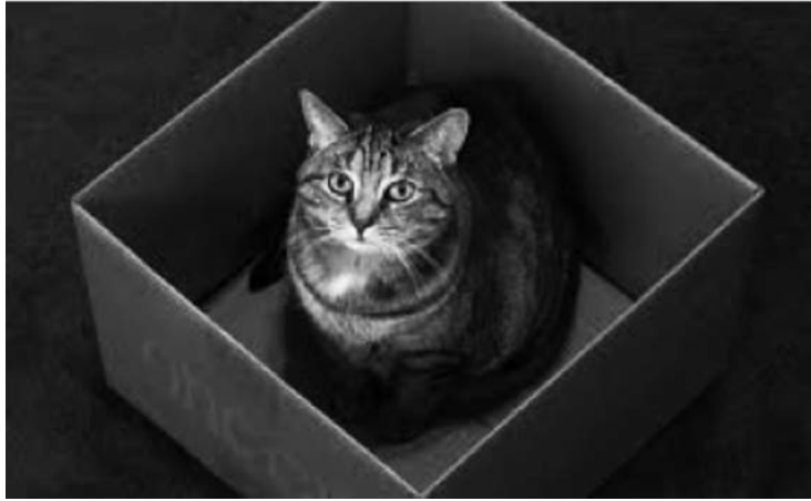
Segons alguns marxistes el “Gat anarquista de Schrödinger” seria, contradictòriament, jerarquizat i desorganitzat.

Els arguments de la FAU, per altra banda, afirmen que a) el poder circula per totes les relacions socials, està vinculat als conflictes i aquests són “interminables”, per tant, es pot modificar però mai deixar d’existir, és a dir, hi ha una relació d’interdependència entre el que té el poder i el que no el té (un el té perquè l’altre no) i b) El “Poder Popular” estaria justificat davant la pèrdua dels valors associats a la