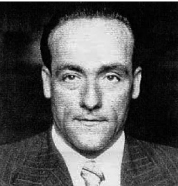
L'anarquista Joan García Oliver (1901-1980) utilitza el terme "exactamente" per referir-se a que la quantitat de violència que utilitzava la CNT en resposta a la de la societat burgesa era la mateixa (ni més ni menys).