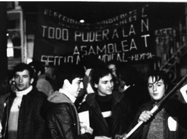
"Todo el Poder a la asamblea" Pancarta de CNT als anys 70.

Mikhail Bakunin ens parla que per fer la revolució: "(...) debemos producir la anarquía y pilotos invisibles en medio de la tempestad, debemos dirigirla, no por un poder ostensible cualquiera sino por la dictadura colectiva de todos los Aliados, dictadura sin faja, sin título, sin derecho oficial, y tanto más poderosa, cuanto que no tendrá ninguna de las apariencias del poder. Esta es la única dictadura cuya organización es saludable y posible: Es esta dictadura colectiva e invisible (...) "