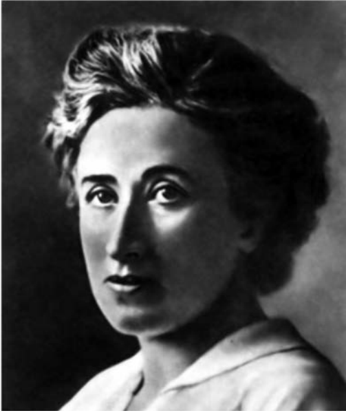
Rosa Luxemburg (1871-1919), referent del marxisme revolucionari no leninista, va analitzar com el fet que les institucions capitalistes estiguessin gestionades per aquells qui diuen tenir-ne uns valors diferents produïa vacil·lacions i dubtes entre el proletariat.

En paral·lel a la imposició de les receptes neoliberals als nostres països, que tendeixen a desmantellar els “Estats del Benestar”, és molt probable que vagin quedant “espais buits” en la prestació de serveis públics essencials col·locant-nos en la disjuntiva de que aquests siguin ocupats per la iniciativa privada o que funcionin en règim d'autogestió pels seus treballadors.