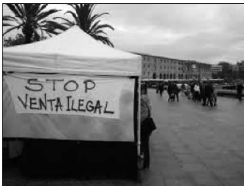
Els disturbis de Salou (agost de 2015) entre manters i policia, i la reacció airada del gremi de botiguers reclamant repressió, tensiona l’univers “popular”.