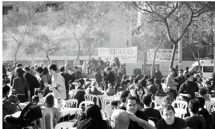
Vista general de la calçotada.

ecològics i gustosos: amanida, puré de patates, escalivada, pa de pagès i òbviament calçots. Al fil de l'objectiu dels organitzadors, la festa estava amenitzada amb es-