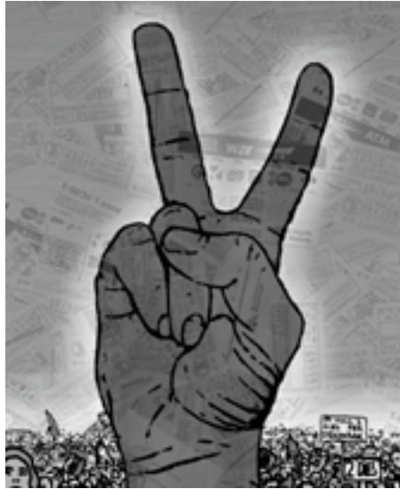
Dibuix de portada del diari "Dos dies".

Aquests conflictes tenen com a tret característic que no són de caràcter econòmic sinó que versen al voltant de la qualitat dels serveis. Cap dels col·lectius fan peticions per a la seva millora corporativa, sinó per a garantir un servei de qualitat que ara mateix no s'està donant. La situació és paradoxal ja que són els treballadors qui reclamen als polítics, allò que en les seves campanyes electorals els polítics prometen a la ciutadania. És legítim, per tant, fer una lectura no corporativa, sinó de reivindicació de classe.