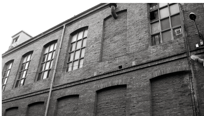
Façana de la nau on han d'anar pisos, al carrer Parellada.