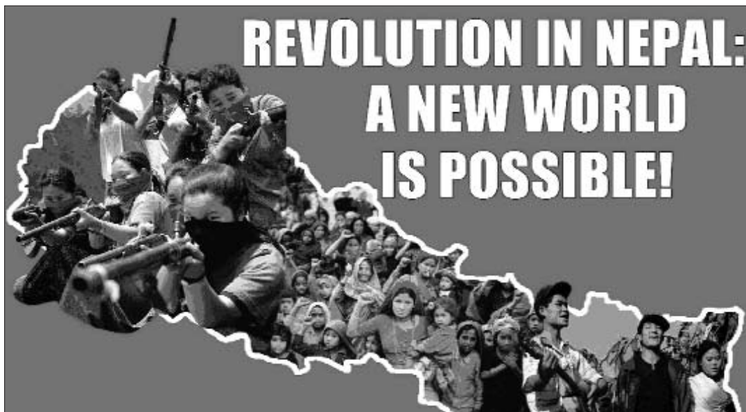
Propaganda revolucionària del Nepal

Després de ser derrotat en l'elecció pels càrrecs de president i vicepresident, el PCN (m) va decidir no encapçalar el govern, malgrat el seu incontestable triomf electoral, i mantenir-se a l'oposició. Dues setmanes més tard va canviar de postura i va accedir a assumir el càrrec de primer ministre i a formar el govern després d'arribar a un pacte amb els socialdemòcrates del PCN-UML (aquesta organització va renunciar fa molts anys al marxisme-leninisme, van col·laborar amb la monarquia en l'etapa més dura i mantenen una postura absolutament conservadora en temes crucials com la reforma agrària), amb el FDPM i altres