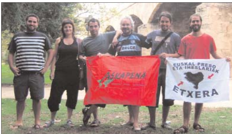
Els sis membres de la brigada, al seu pas per la ciutat de València

És veritat que sempre que s'organitzava una activitat a Euskal Herria es constata una forta presència de gent que hi acudia dels Països Catalans. Des d'Euskal Herria sempre hi ha hagut aquesta percepció solidària, mentre que al mateix temps, des d'Euskal Herria cap als Països Catalans no hi ha hagut una solidaritat tan activa. A més a més, també és cert que encara hi ha una gran desconexió de la realitat dels Països Catalans i dels moviments que actuen en defensa de la seua sobirania, identitat i en el procés de lluita per l'autodeterminació. Nosaltres volem conèixer de primera mà aquesta situació per traslladar-la al nostre país. Aquesta és la primera brigada que es fa i el seu objectiu és obrir una dinàmica de relacions que es faça més estable.