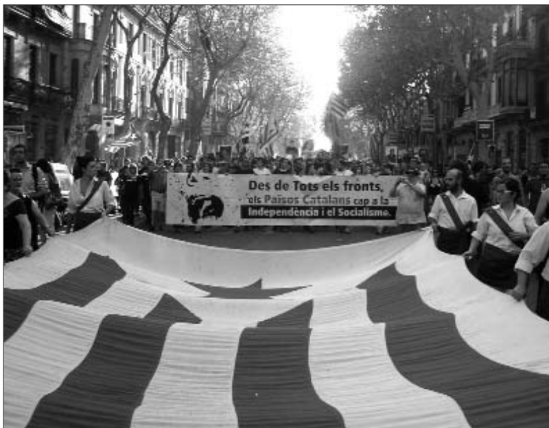
Capçalera de la manifestació independentista de l'any passat

Més enllà de Barcelona, la Diada té tres altres punts neuràlgics: Girona, Lleida i Reus. En aquesta darrera població l'Esquerra Independentista del Camp (EIC) -formada per una vintena de col·lectius i assemblees- convoca una manifestació amb el lema "Al Camp, 300 anys resistint". Tanmateix, els dies previs, i també posteriors, les convocatòries locals i comarcals s'estenen arreu del Principat (veure columna). En destaca la de Tortosa, ja que suposa la primera vegada a la història que es realitza una commemoració popular de l'Onze de Setembre a les Terres de l'Ebre precisament quan es compleix el tercer centenari de la caiguda de Tortosa. Josep Sabater, portaveu de Maulets, explica a L'ACCENT la importància d'un acte que agrupa a col·lectius d'ambdues bandes del Sènia i que esdevé, a la vegada, una mostra de la consolidació de l'independentisme en aquestes comarques així com del reconeixement de la seva pròpia identitat. La cultura popular i les torxes al castell de la Suda seran un dels elements