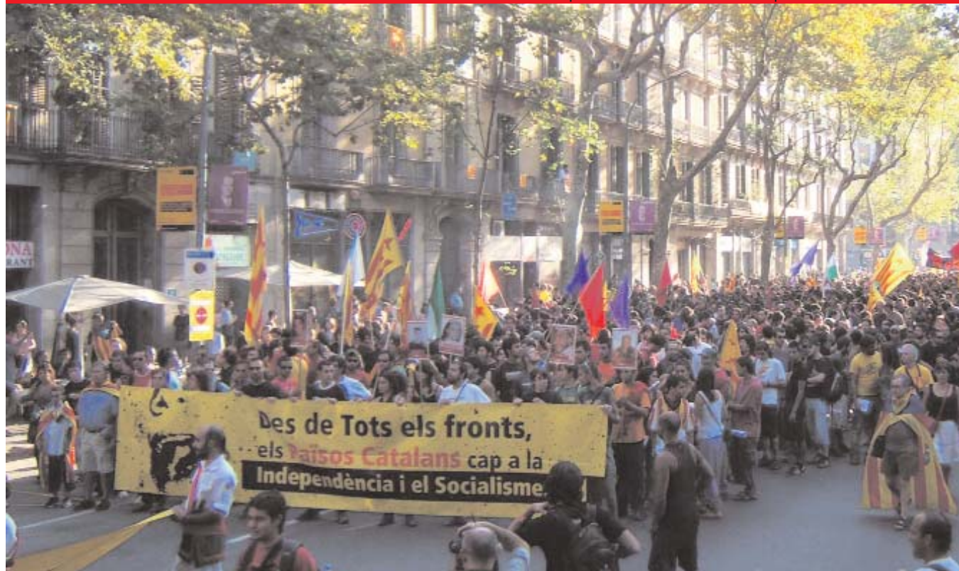
Manifestació de l'esquerra independentista l'Onze de Setembre de l'any passat