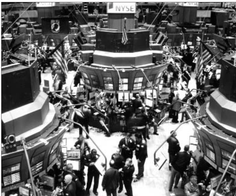
La crisi econòmica augmenta el debat sobre les alternatives al capitalisme

D'una banda, considero que les teories del decreixement no expliquen que la força fonamental d'impuls del sistema capitalista és l'acumulació de capital i el benefici. En aquesta línia tots en som una mica còmplices en ser un sistema