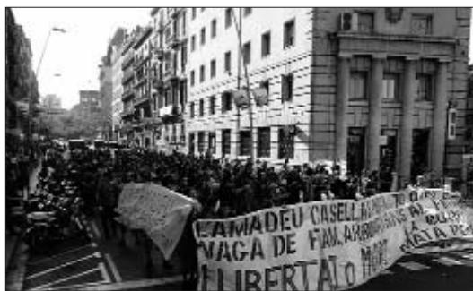
Manifestació de suport pels carrers de Barcelona