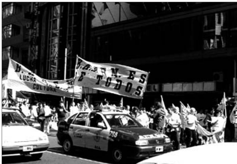
Manifestació a les portes de l'Hotel Bauen

En entrar el primer que ens va venir el cap és que ens enviarien la policia, que no ens permetrien recuperar un