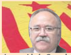
Josep-Lluís Carod-Rovira Conseller de la Vicepresidència de la Generalitat de Catalunya i ex-militant del PSAN

No hi ha cap dubte en considerar la fundació del PSAN l'any 1968 com un dels fets més transcendents en la història de l'independentisme combatiu modern. No debades, els eixos polítics definits fa quaranta anys continuen sent la base programàtica de l'Esquerra Independentista actual: la lluita per la integritat territorial dels Països Catalans, la independència com a via d'emancipació, i el socialisme com a model de justícia i igualtat social, incorporant amb els anys la lluita antipatriarcal i la defensa del territori. L'EI actual és hereva dels encerts dels darrers 40 anys, en què el PSAN ha jugat un paper central fins l'any 1995, però també de les errades i possibilitats d'alguns sectors.