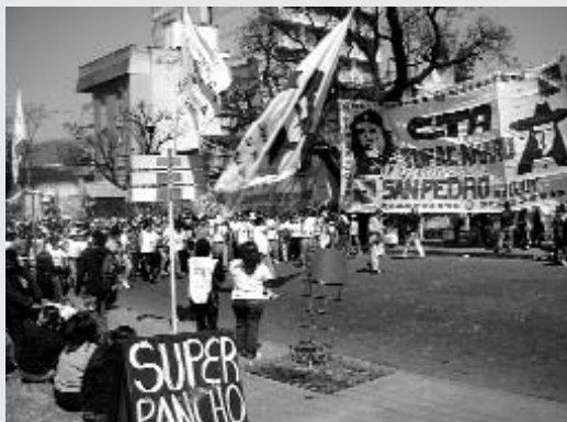
Manifestació pel centre de Jujuy

L'origen d'aquest moviment són les anomenades "copos de llet". Per lluitar contra la fam, la central sindical CTA va apostar a partir del 2000 per confeccionar als barris més necessitats un cens de nens que no complien els àpats mínims diaris, organitzant