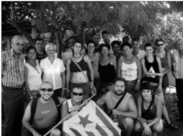
Els brigadistes catalans amb membres de la cooperativa Félix Duque

En el cas de la Venceremos, brigada de solidaritat amb Cuba, la seua estada a l'illa del Carib també es va produir el mes d'agost. Com en anys anteriors va