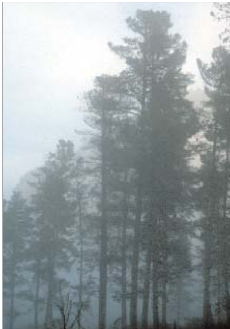
Bosc afectat per la pluja àcida

Per altra banda, cal remarcar que la importància econòmica d'aquest sector és considerable. A l'Estat espanyol les activitats lligades al transport tenen un pes de participació al PIB del 5% i suposen un 13% dels pressupostos familiars. Podem dir, per tant, que aquest sector té un pes molt important al sistema productiu global, fins el punt que sectors directament lligats com la construcció, la enginyeria civil o la producció de derivats del petroli o cautxú i plàstics representen el 25% del PIB. Respecte a l'ocupació del territori, s'estima que les infraes-