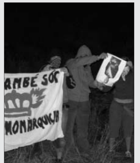
Acció anitmonàrquica solidària amb els encausats