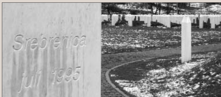
El cementiri de Srebrenica, més de deu anys després