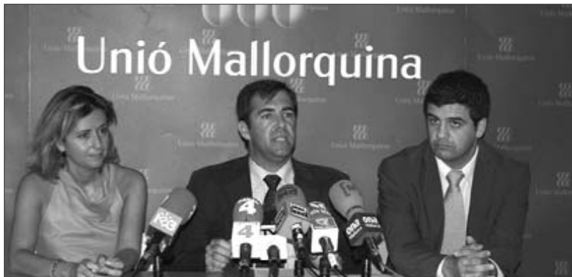
Els dirigents d'Unió Mallorquina van pressionar per a que la Llei arribara al Parlament

Aquesta recollida de signatures no va ser necessària, ja que Unió Mallorquina va pressionar abans que la Llei arribés al Parlament. Les reunions periòdiques iniciades entre Miquel Nadal, actual president d'UM, i Francesc Antich van fer que la consellera tornés als antics terminis d'admissió fins al mes de juny, i afirmà que "tal vegada, fa falta explicar-ho un poc més per aclarir aquest decret a aquells que tenen una opinió en contra". Això va provocar la satisfacció al partit de Nadal, des d'on es va arribar a afirmar que "afavorirà" als mallorquins que es trobin en llistes d'espera.