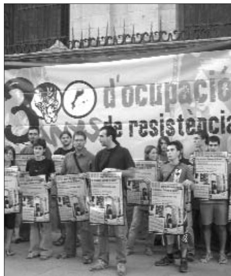
Presentació de la manifestació de l'any passat a Lleida

Encara que el gruix de les mobilitzacions s'hagen centrat als mesos d'abril, en realitat, al llarg de tot l'any es van celebrar multitud d'actes a tota la geografia dels Països Catalans. Per als portaveus de la campanya, aquesta descentralització és una demostració evident de l'encert que va suposar tirar-la endavant i de la seua fortalesa. De fet, com apunten, des de les mobilitzacions d'abril de l'any passat s'han fet activi-