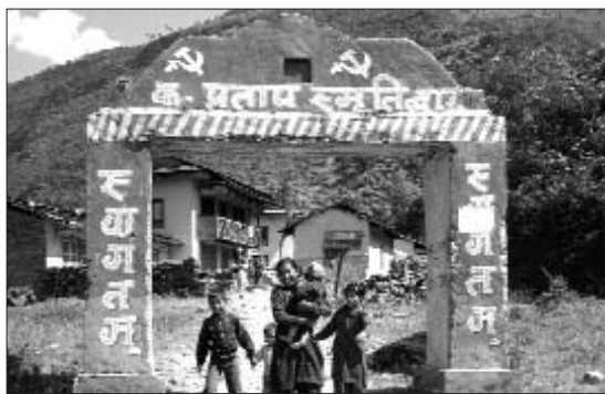
Vall controlada per la guerrilla maoista

des de la seva independència tutelada de 1948. De fet, els britànics van aplicar al Nepal el model neoinperial i clientelar que també van imposar a grans parts del seu antic imperi durant el procés descolonitzador; és a dir, van cedir tota la sobirania del país als mateixos que ja l'administraven durant el període colonial, en aquest cas a la casa reial. Des de 1948 es van succeir llargs períodes de sistema panchayat -monarquia absoluta- amb breus períodes parlamentaris ofegats sempre per vetos reials. Mentrestant les desigualtats socials i el desprestigi de la institució monàrquica no feien més que créixer. L'any 2005 el Nepal comptava amb el tercer pitjor Índex de Desenvolupament Humà d'Àsia i sols tenia el 45% de la població alfabetitzada.