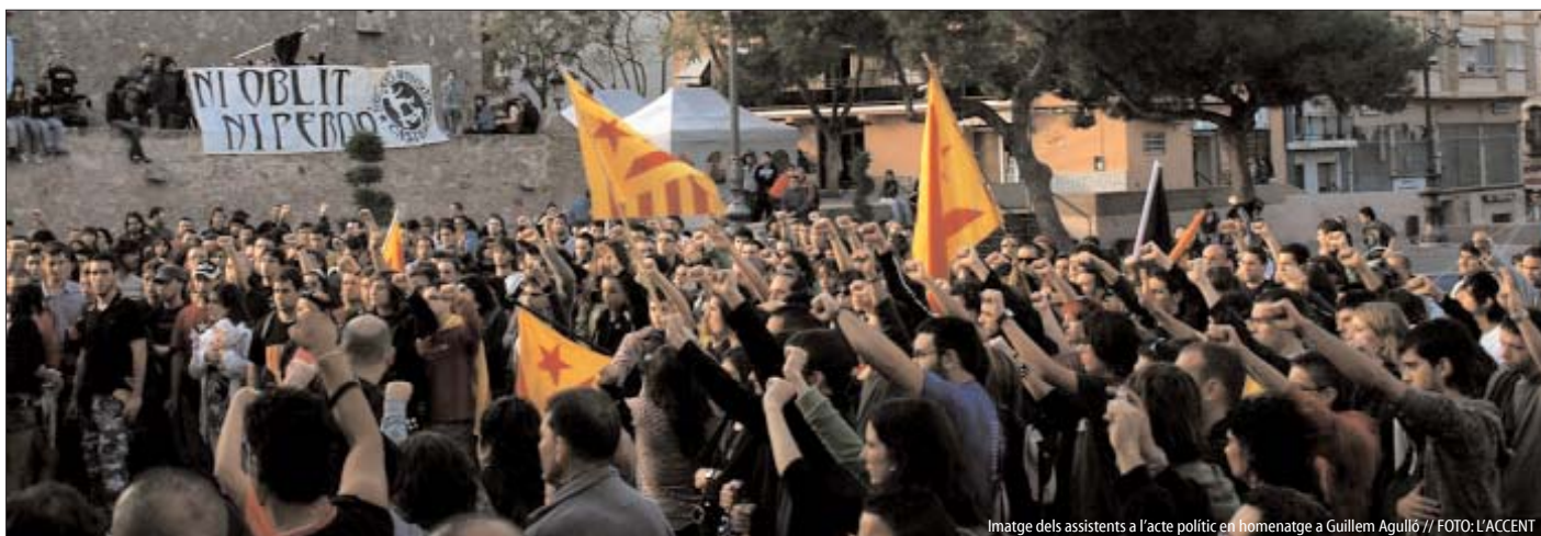
Imatge dels assistents a l'acte polític en homenatge a Guillem Agulló

Un miler de persones es van congregar a Burjassot (l'Horta Nord), ciutat natal de Guillem Agulló, per homenatjar-lo quinze anys després del seu assassinat. Amb la jornada commemorativa va