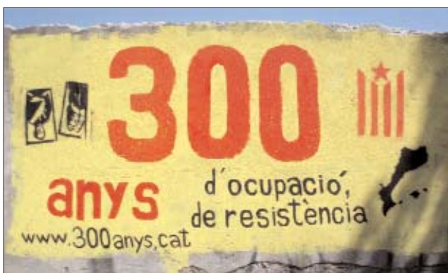
Mural de la Campanya realitzat a Badalona

El mes d'abril és cada any un punt clau en les mobilitzacions independentistes. Quatre cites en el calendari: el 23 a Barcelona, el 25 a València i el dia 26 a Sueca i a Alacant. En els dos primers casos es tracta de mobilitzacions convocades per la campanya "300 anys d'ocupació, 300 anys de resistència". A la capital de l'Alacantí es traslladarà la multitudinària manifestació de la Diada convocada per Acció Cultural -i per desenes d'entitats així com per part de l'esquerra independentista- amb motiu del tancament del repetidor de TV de la Carrasqueta.