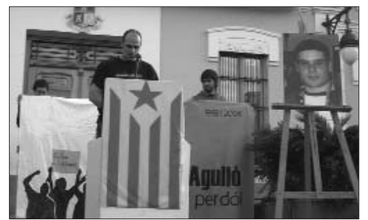
Parlaments durant l'acte polític// FOTO: L'ACCENT