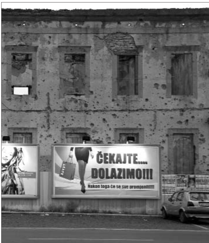
Als carrers de Mostar es barregen les restes de la guerra amb l'arribada del capitalisme

El gran mal de la Bòsnia actual és l'abandonament i la falta de recursos, caldria fer un gran esforç internacional per millorar la seva situació; allà, tots tenen la sensació que a ningú l'importa el que passa a Bòsnia. Una vegada acabada la guerra, l'ONU envià un contingent per salvar la cara i ajudar a la reconstrucció. Quan preguntaves a la gent d'allà el que havien fet les tropes de l'ONU per ells, una de les respostes típiques era: jugar al mus. Se suposa que