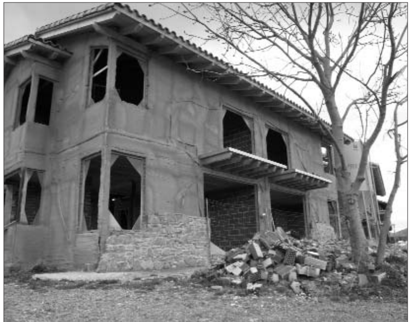
La crisi hipotecària afecta el sector de la construcció

Quan els tipus d'interès es comencen a incrementar pel canvi de cycle, provoquen impagament de les hipoteques més sensibles (les subprime). Els derivats tenen el doble efecte d'amplificar les pèrdues i de retransmetre-les a altres economies. Cal tenir en compte que el mercat de CDO aplegava