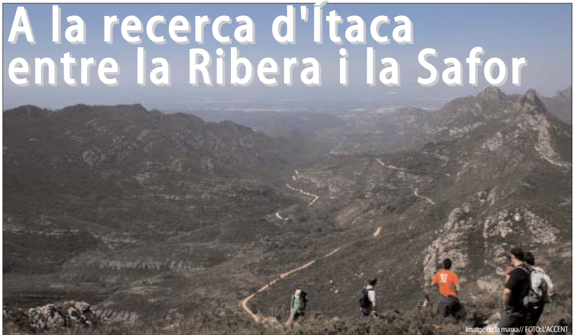
Imatge de la marxa

*Regidor de la Candidatura d'Unitat Popular a l'Ajuntament de Vilafranca del Penedès