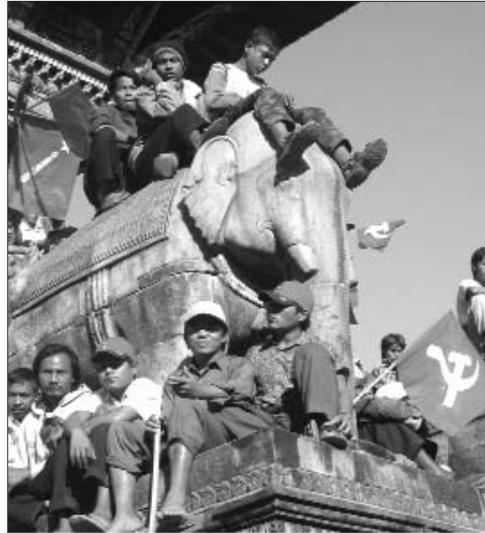
Miting polític del partit comunista (maoista) del Nepal

reial el juny de 2002, quan el príncep hereu Dipendra va assassinar a sang freda a la pràctica totalitat de la família reial, inclosos el rei i la reina. Dipendra va esdevenir rei durant uns dies tal i com marcava la tradició, tot i que finalment va ser substituït pel seu oncle Gyanendra. Aquest succés no va fer més que desprestigiar encara més la imatge de la monarquia entre