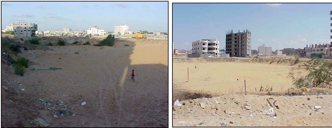
Vista inicial de l'espai on s'ha urbanitzat el Barcelona Peace Park

El Barcelona Peace Park s'ha construït al barri de nova construcció (i densament poblat) de Tal-al-Hawa, la seva superfície és de 1,3 Ha (més del doble de la de l'anterior parc). Ha calgut fer un projecte completament nou, dissenyat per Carles Casamor, arquitecte de Projectes Urbans de l'Ajuntament de Barcelona. El nou espai incorpora també instal·lacions esportives, amb la idea d'oferir també espais de lleure als joves palestins. Es tracta d'un espai amb un tractament modern i molt polifuncional, diferent al que són els parcs (escassos) de Gaza.