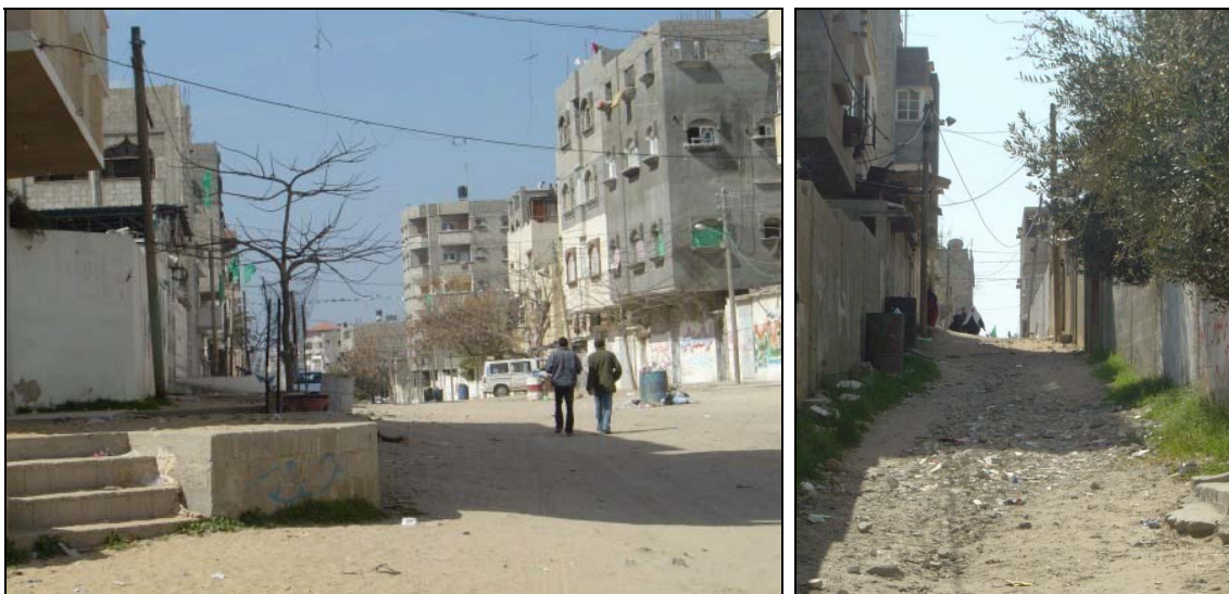
Vistes actuals del barri d'East al-Nasser

La primera Trobada de Ciutats Europees Agermanades amb Gaza (Barcelona, 2001) va permetre posar en marxa l'estudi d'un primer disseny del projecte de treball urbanístic i social en una àrea concreta de la ciutat de Gaza: el barri al-Nasser . Posteriorment, a partir d'estudis previs redactats conjuntament entre tècnics municipals dels Ajuntaments de Gaza i Barcelona en juliol de 2002, maig de 2003 i novembre de 2004, s'ha concretat en la proposta que ara es presenta.