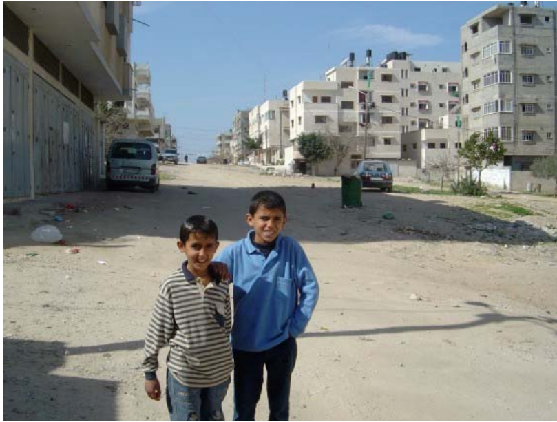
Barri d'East al-Nasser

Els carrers objecte d'intervenció parcial, donat que tenen part de les seves calçades o voreres ja urbanitzades son : Palestine st., el-Nasser st. i Omar Bin el-Kathab st.