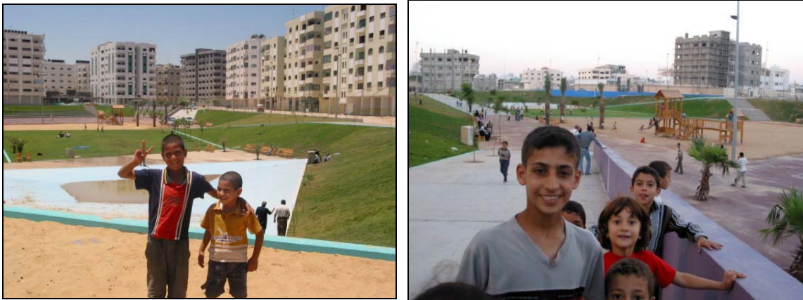
Imatges de com ha quedat urbanitzat el Barcelona Peace Park

El Parc s'inaugura el 17 de març de 2005 , amb la presència a Gaza de l'alcalde de Barcelona, Joan Clos. El seu pressupost ha estat de 300.000 euros (el pressupost no s'ha alterat malgrat el canvi d'emplaçament i l'augment de superfície).