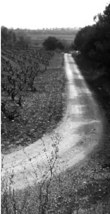
3 Afectació de la C-15 al pas pel camí de Sta. Maria dels Horts