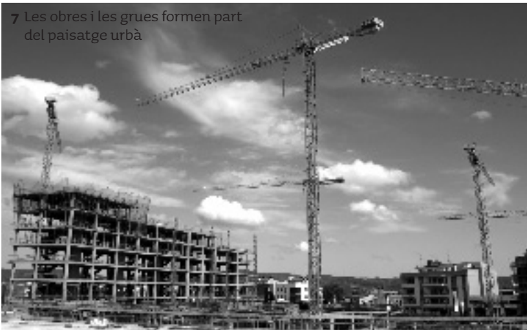
7 Les obres i les grues formen part del paisatge urbà