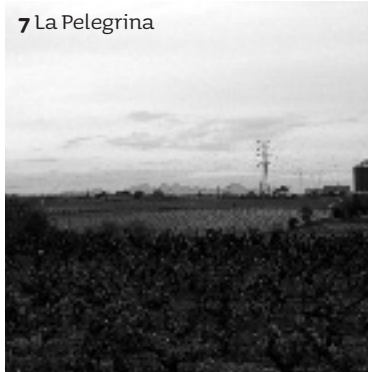
7 La Pelegrina