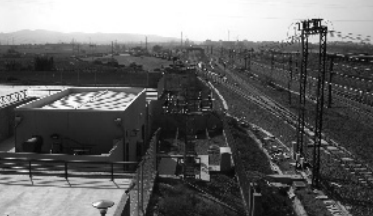
2 ...ara hi ha la base de manteniment de l'AVE