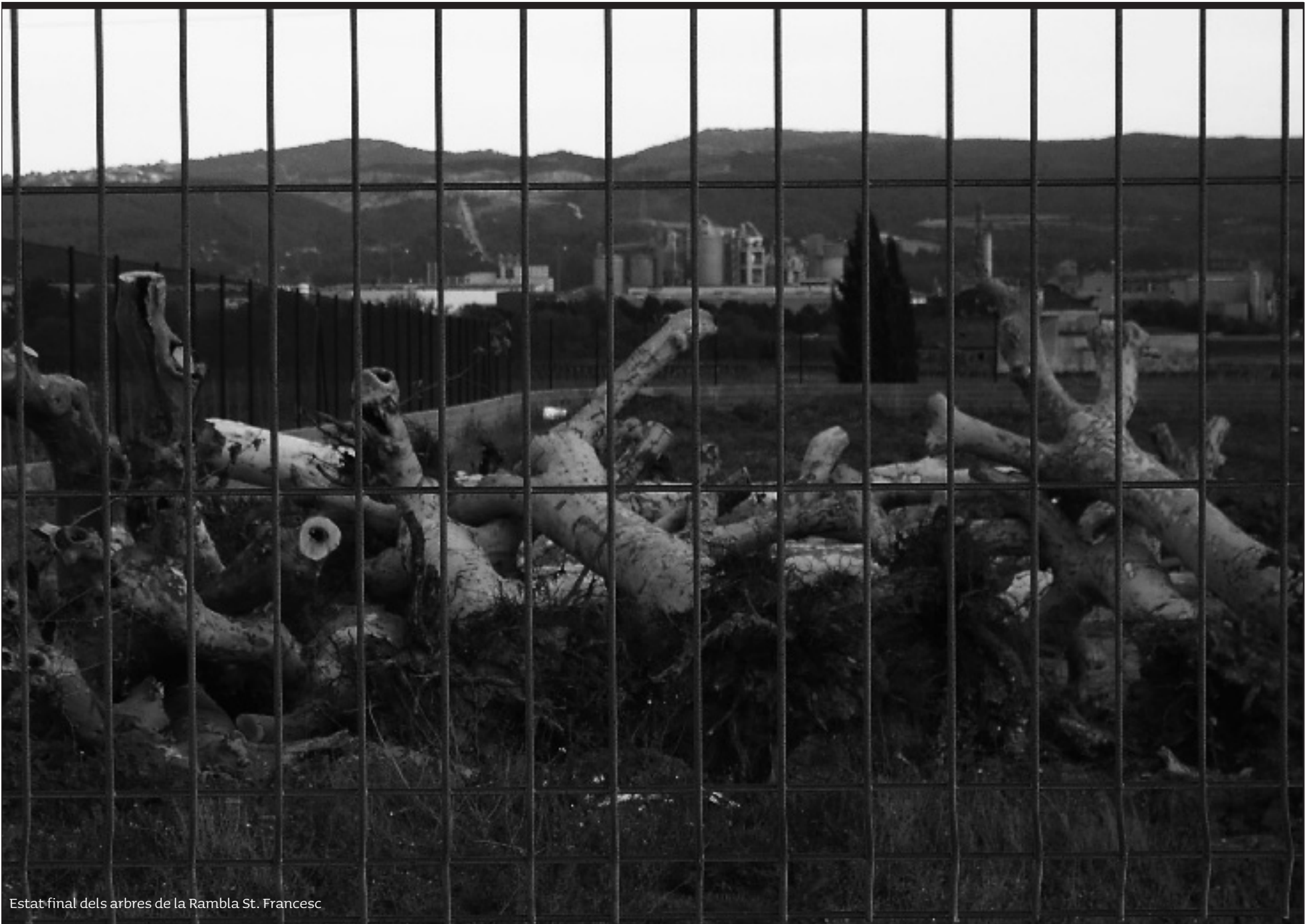
Estat final dels arbres de la Rambla St. Francesc