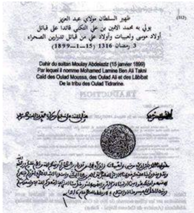
Documento en árabe avalando la marroquinidad del Sáhara