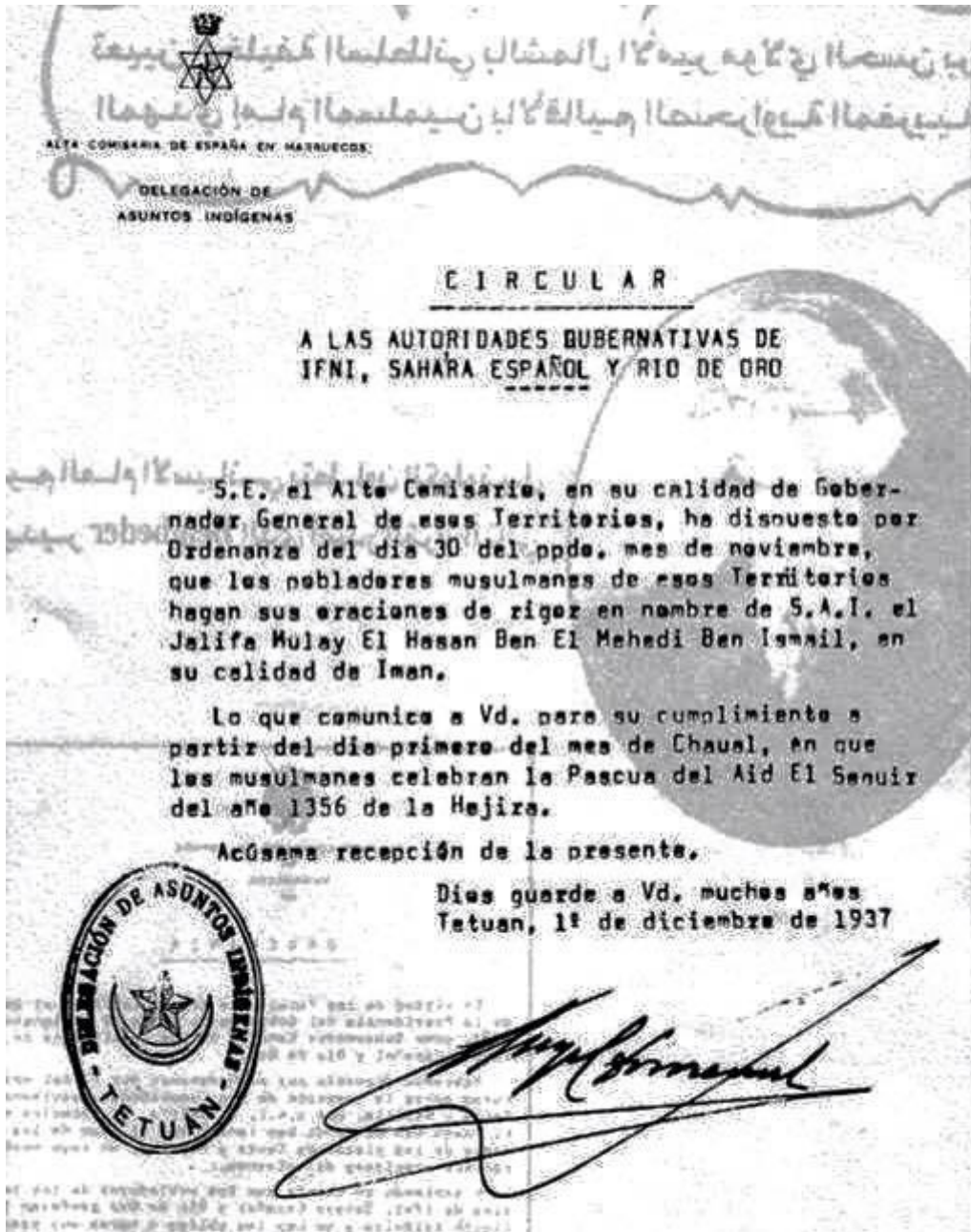
Documento de 1937 en el cual las autoridades españolas reconocen la autoridad de Marruecos sobre el Sáhara