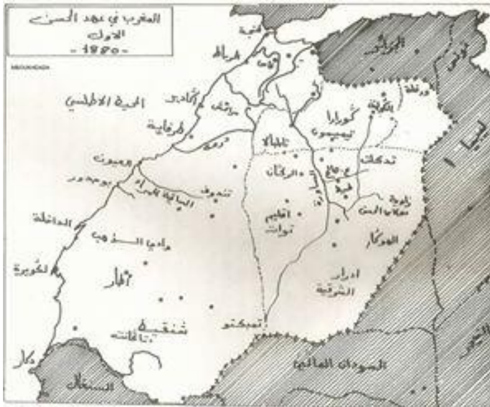
Mapa que marca los dominios del Sultán de Marruecos en el siglo XIX