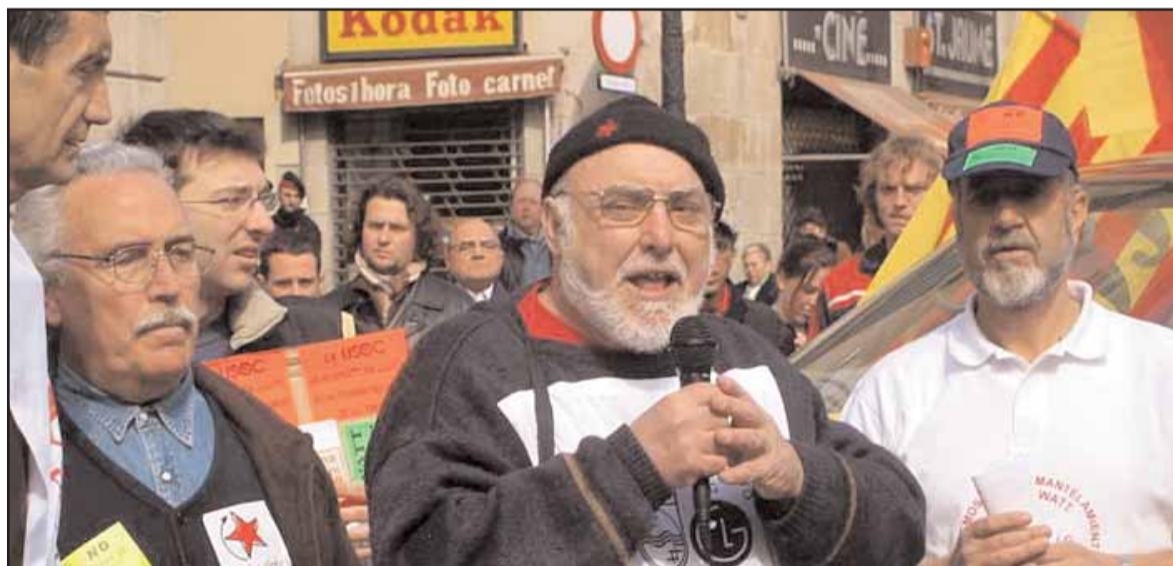
Lectura final del manifest durant la manifestació del diumenge 6 de març contra el tancament de Miniwatt

Un miler de persones es va manifestar el diumenge 6 de març pel centre de Barcelona en contra del tancament de l'empresa Miniwatt, propietat de la multinacional Philips-LG. Aquesta jornada de mobilització s'emmarca dins les protestes que impulsa el comitè d'empresa des de fa mesos per evitar que centenars de persones es quedin sense el seu lloc de treball. Una de les darreres protestes que ha protagonitzat la plantilla de