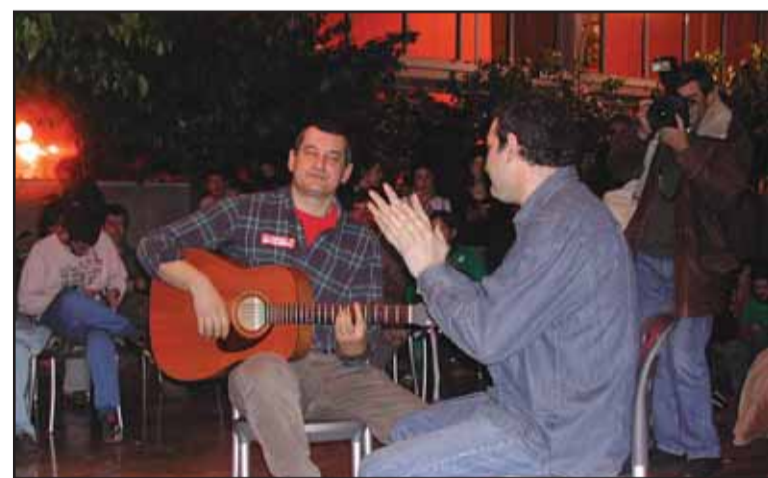
Actuació-protesta dins del Palau de la Música

El Palau de la Música de València va ser l'escenari de la primera gran protesta dels músics en català del País Valencià. Unes dues-centes persones entre músics i públic simpatitzant van ocupar l'emblemàtic edifici de la ciutat del Túria per denunciar la nul·la presència d'artistes i produccions en llengua pròpia en els mitjans de comunicació públics. Segons van denunciar en una roda de premsa posterior, la RTVV incompleix la seua pròpia llei de creació en "censurar i castrar sis-