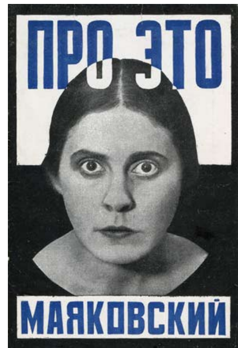
Cartell d'una obra de teatre de Maiakovsky.

El teatre tampoc va escapar de la ment renovadora d'Aleksandr Ródtxenko, que va idear decorats i vestuari per a una obra escrita per un altre artista soviètic, Maiakovsky. L'austeritat era un dels pilars fonamentals de la seva obra, i així