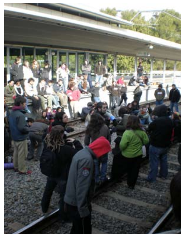
Estudiants a les vies dels ferrocarrils fent una concentració en suport dels expedientats

i debat tan necessari entre la institució i els estudiants en vistes dels profunds canvis que es volen instaurar a l'espai universitari.