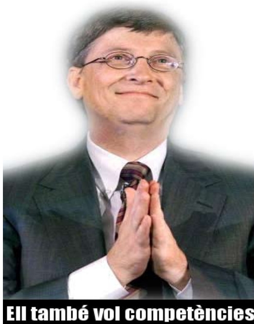
Ell també vol competències

el camp de la informàtica és insuficient per al correcte desenvolupament de les activitats esmentades i, per tant, no pot considerar-se una branca d'aquest.