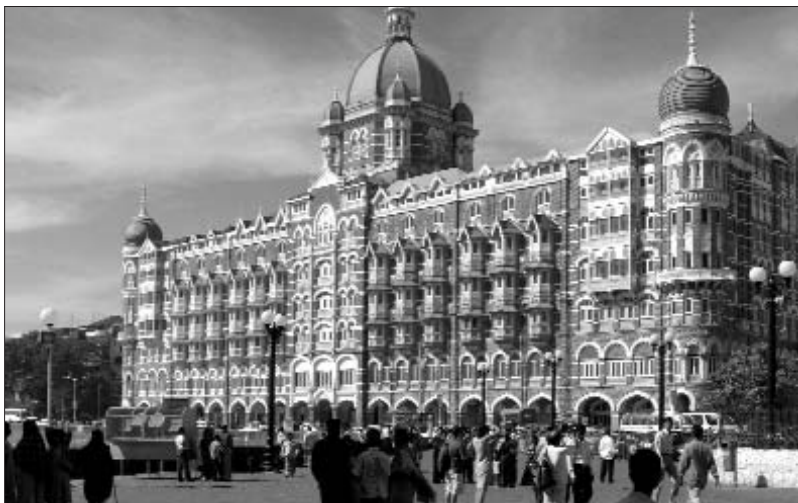
El Taj Mahal Hotel fou un dels escenaris de ls recents atemptats