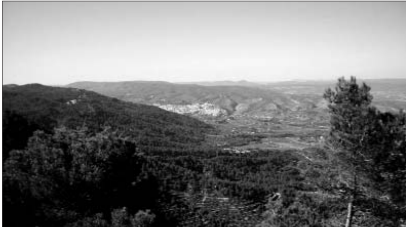
Panoràmica de la Vall d'Agres

El projecte d'Eix Transversal Villena - Muro consisteix en la construcció d'una via directa, de doble calçada i diversos enllaços, que comunicaria l'autovia A-31 i la carretera N-340, entre aquestes poblacions de l'Alt Vinalopó i el Comtat. En un dels seus trams, a la vall del riu Agres, entre Bocaire i Muro, la carretera prevista hauria de comptar amb un traçat nou. Una de les àrees que patiria un major impacte seria la de la Valleta d'Agres, una zona que comunica dos espais naturals protegits, els del parc natural de la Serra Mariola i la Solana del Benicadell. Els plans de construcció de l'autovia, que han estat proposats per la Conselleria d'Infraestructures de la Generalitat Valen-