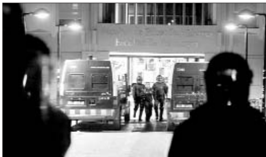
Detenció d'una estudiant pels Mossos a la UAB, el curs passat