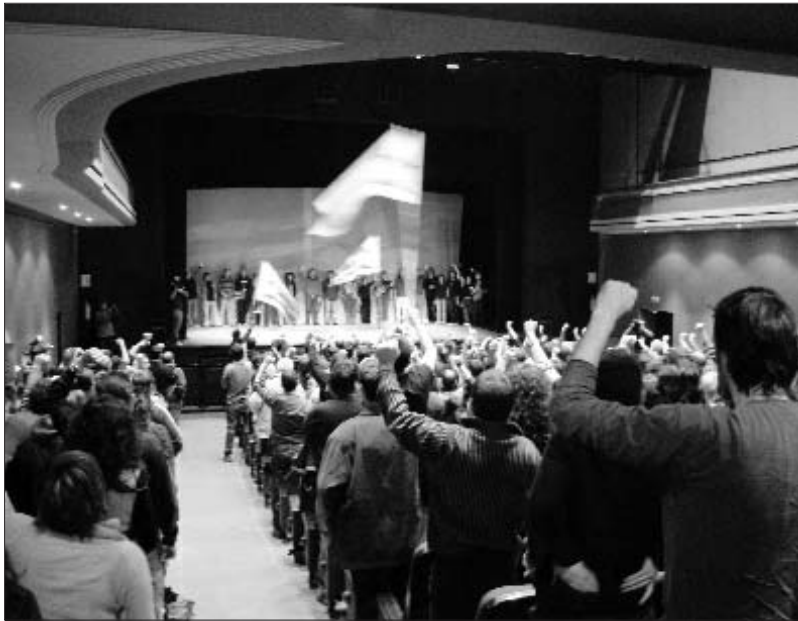
500 persones van omplir el Teatre Municipal de Berga convocades per la CUP

"Han passat quaranta anys i el món ha canviat. Sí, ha canviat, però no en el sentit que ens intenten