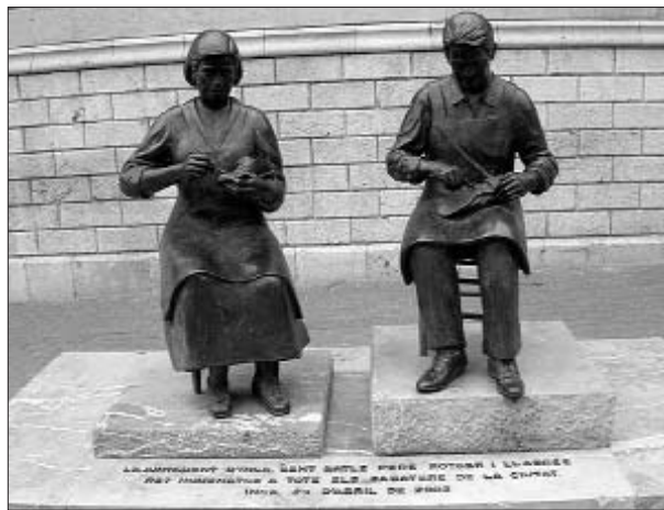
Homenatge als sabaters d'Inca