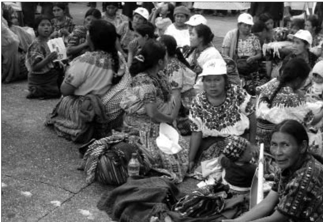
Els sectors estratègics de Centre Amèrica són un objectiu de la Unió Europea