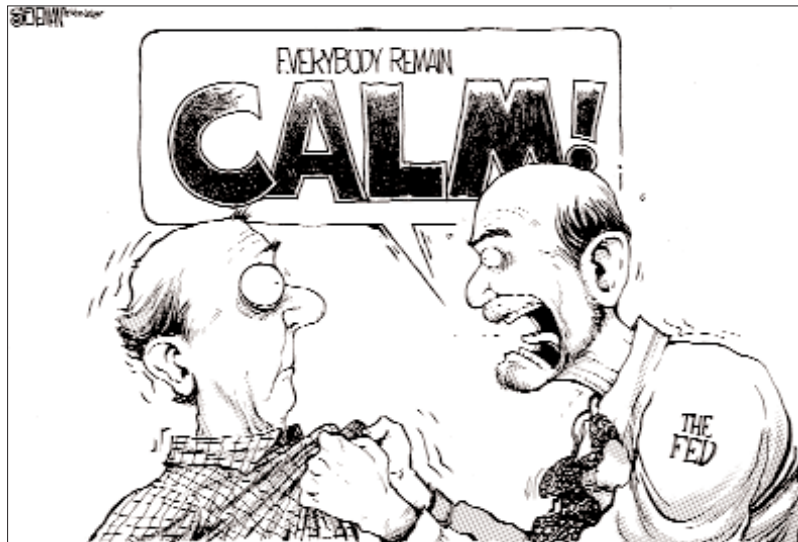
La crisi ha nodrit d'arguments els humoristes de la premsa. A la imatge, la Sistema de la Reserva Federal diu "Mantingueu tots la calma"

guanyen en el sector financer, en accions, crèdits,... són exponencialment superiors als de l'economia real, i a més l'inversor s'estalvia problemes amb els treballadors o de conflictes socials; i és que amb un simple ordinador avui en dia es poden comprar productes financers en qualsevol mercat del món. El resultat és que els diners s'inverteixen sense passar per l'economia real i productiva.