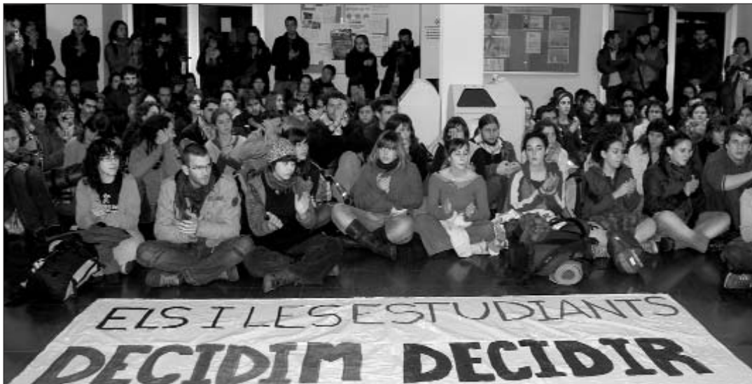
Cent-cinquanta estudiants van ocupar la Facultat d'Educació i Psicologia de Girona

En els darrers dies un dels elements més destacats ha estat la redacció d'un manifest impulsat pel Departament de Psicologia Social de la UAB a favor del diàleg i de la retirada dels expedients disciplinaris contra 28 estudiants d'aquesta universitat (veure L'ACCENT 143). El text, firmat per més de dos centenars de professors i investigadors reclama interpretar les mobilitza-