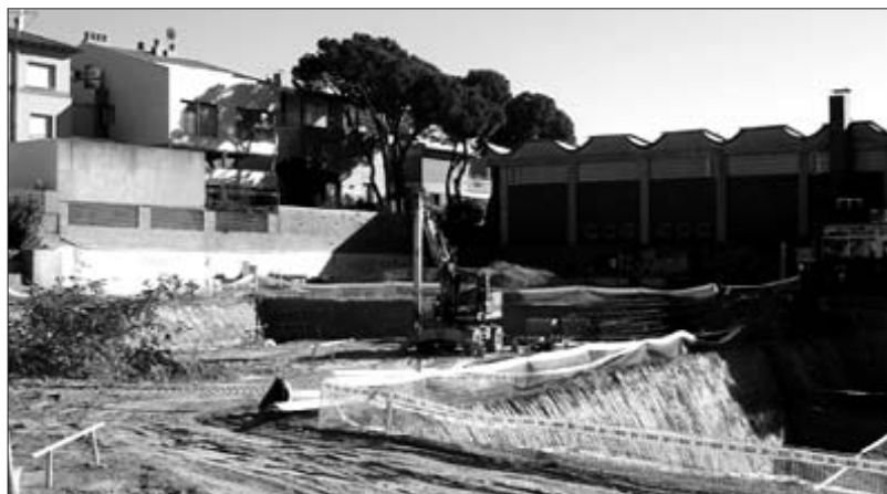
Obres de la piscina municipal, l'any 2006

Per una altra banda, aquest consistori municipal ja va rebre una allau de crítiques pel desgavell econòmic que va suposar la construcció del complex municipal de piscines (piscina coberta), on per voler inaugurar amb presses les instal·lacions en època electoral, van aparèixer filtracions d'aigua que van suposar un cost afegit 351 milions de les antigues pessetes, que va haver de pagar el consistori amb les arques públiques. No és d'estranyar doncs que les retallades econòmiques, fruit de la mala gestió, s'hagin vist reflectides en les ajudes a les AMPA per preparar les festes de fi de curs, la retallada d'activitats per la Fira, la disminució de suports als organitzadors de les revetlles de Sant Joan, les activitats informatives d'AI-