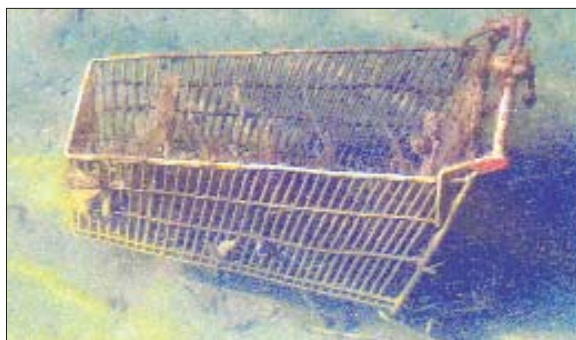
El decreixement és una alternativa real a la societat de consum?