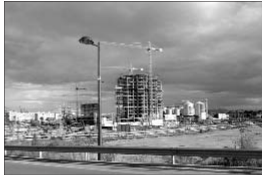
Construcció de gratacels al barri de Nazaret, prop del circuit de Fórmula 1

Així, la devolució del cànon que en el seu moment va pagar l'Ajuntament (amb l'IVA corresponent) permetran al consistori disposar de 7,3 milions d'euros, que ha anunciat que destinarà a comprar les participacions del Cabanyal 2010. Amb això i els diners que aporte la Generalitat valenciana s'haurien de cobrir