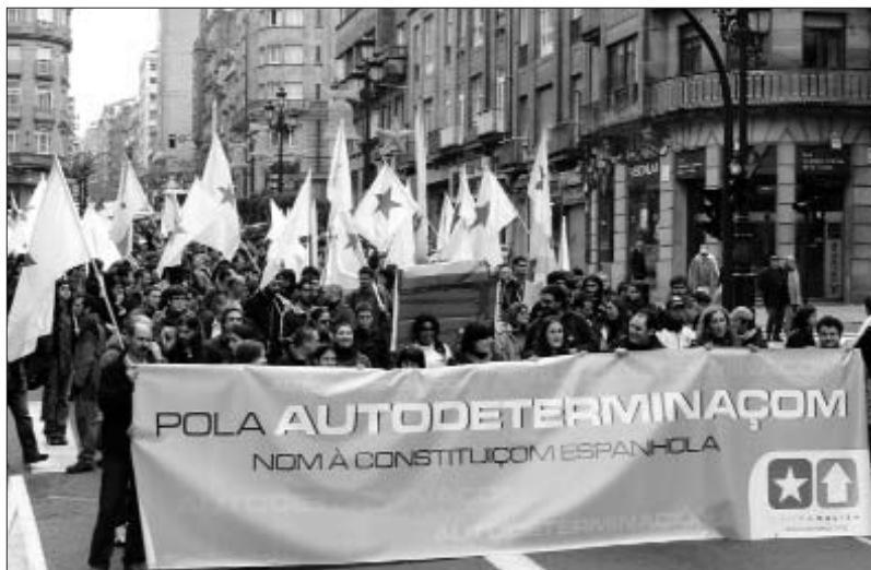
Manifestació a Vigo contra la Constitució espanyola

Primeira Linha, a l'estil dels partits comunistes clàssics, és una organització de quadres que fa una important tasca ideològica, en destaca la publicació de llibres a l'editorial Abrente. Així mateix, publiquen una revista de lluita ideològica que duu el mateix nom que l'editorial. A més, anualment organitzen les Jornades