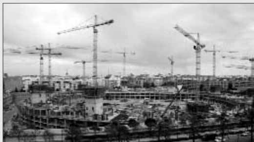
Les obres del Nou Mestalla s'han alentit

El València Club de Futbol no s'escapa del binomi especulació urbanística i esports. Però tampoc escapa de la greu crisi que travessa el sector immobiliari. En aquest sentit en els darrers dies s'ha fet públic que el projecte urbanístic de Mestalla -consistent en substituir l'estadi del club xe per 630 habitatges- també té problemes. Tanmateix des del club s'intentarà superar les dificultats canviant pisos per oficines.