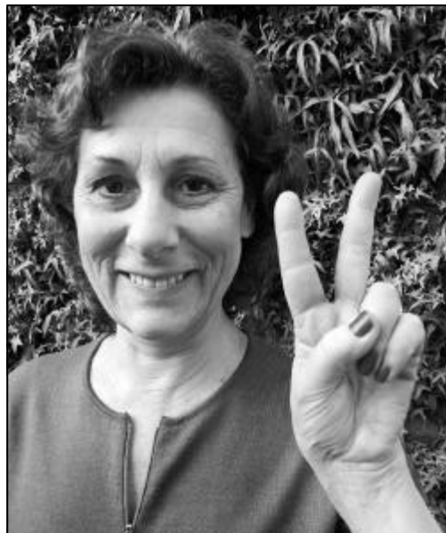
“El que demanen és de justícia” Carme Sansa • Actriu