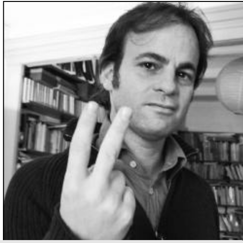
“Cal recordar que els drets no són regals atorgats per l'Estat, sinó dures conquestes guanyades des de la societat” Jaume Asens • Comissió de Defensa Col·legi d'Advocats