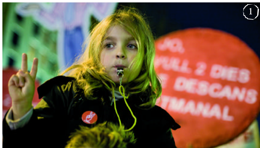
1.- Manifestació de suport a la lluita dels conductors i les conductores, dissabte 9 de febrer.