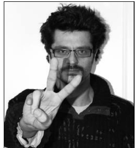
“Us imagineu 365 dies, 50 setmanes a l'any amb un sol dia de vacances a la setmana?” Joel Joan • Actor