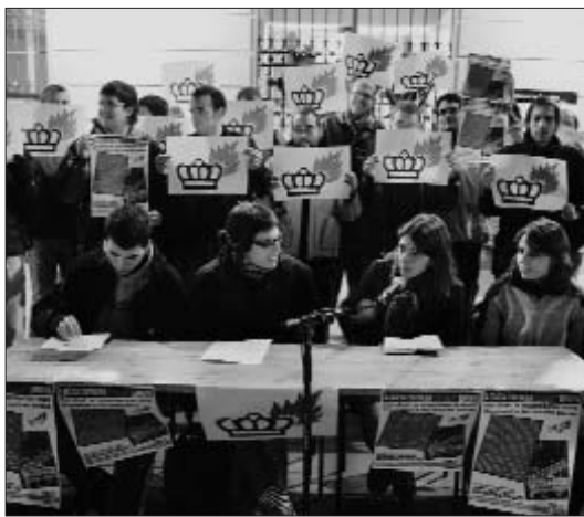
Vint entitats donen suport als quatre antimonàrquics multats

Durant la roda de premsa d'aquest dimecres, les entitats han exigint al Districte de Gràcia una presa de posició davant de les multes. I han afegit que esperen que aquest posicionament sigui de suport a les persones multades, sobretot tenint en compte que aquest divendres 28 la seu del Dis-