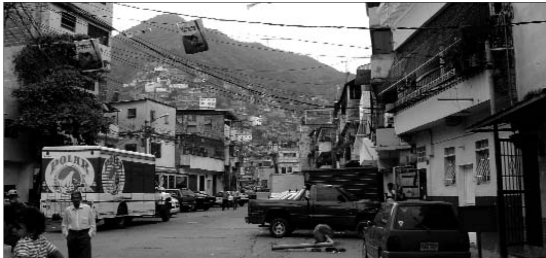
Barri de La Vega, de Caracas

Però no només hem de trobar les causes en l'oposició, també hem de tenir en compte que en el procés revolucionari, la mala gestió de l'alcalde sortint Juan Barreto, que no ha assolit els resultats que d'ell s'esperava, ha influït en l'augment de l'abstenció. Més enllà d'això s'ha de fer una reflexió del perquè bona part de l'electorat dels barris populars no va anar a votar, aquests barris són el puntal de la revolució bolivariana i és el motiu principal del la pèrdua del referèndum d'ara fa un any. La gent no es va mobilitzar en part, ja que bona part dels candidats del PSUV no van ser escollits des de la base, però també perquè s'ha perdut aquell entusiasme que la gent tenia al principi d'aquest procés. Com diu l'histò-