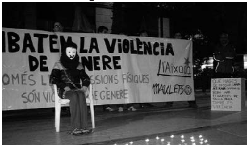
Acció contra la violència de gènere a Torrent, l'Horta

La qüestió, la de l'enriquiment a qual-sevol preu, que és el que marca la principal dinàmica del capitalisme, afectarà especialment les dones els