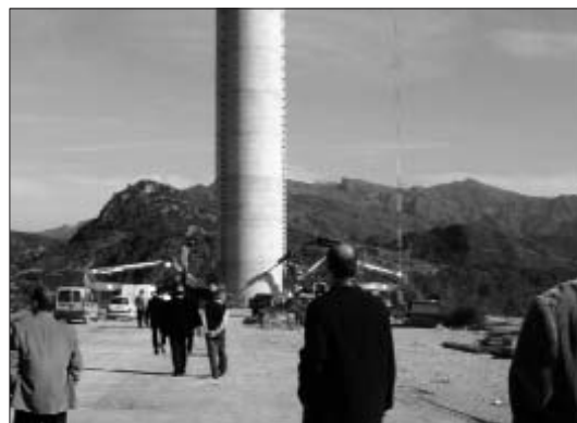
Torre d'impulsió del futur canal Xerta - Sènia

Cal destacar però que les obres del polèmic canal han destacat pel silenci i l'hermetisme informatiu fins a les denúncies de la PDE i Unió de Pagesos. En aquest sentit sobta que, a hores d'ara, no existisca cap compromís amb els llauradors per