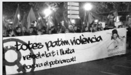
Pancarta de l'esquerra independentista a la manifestació de València

Nombrosos punts de la geografia se sumaren a la denúncia d'aquesta xacra. A Tortosa tingué lloc una paradeta antipatriarcal amb exposició i performances. A Vilafranca del Penedès pintada d'un mural al Parc Sant Julià junt amb altres accions formatives. A Sabadell, el diumenge 23 de novembre a la Plaça Imperial hi hagué una concentració amb un espectacle de teatre, la lectura d'un manifest i berenar inclòs; mentre que a Carcaixent el 28 es va celebrar un sopar popular a l'Ateneu Popular La Força, els beneficis del qual seran destinats per finançar més campanyes sobre aquest tema. A Torrent, Maulets i l'AJ de l'Horta Sud es concentraren el 28 i simbolitzaren amb una