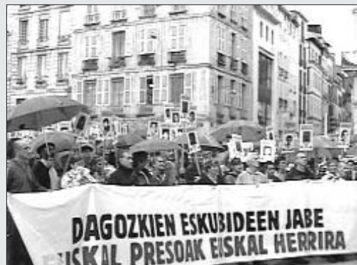
Mai com ara hi havia hagut tants presos polítics bascos a les presons

Durant l'acte, la representant de l'esquerra independentista basca va agrair l'oportunitat que els oferia Amics i Amigues d'Euskal Herria d'anar a Barcelona a expli-