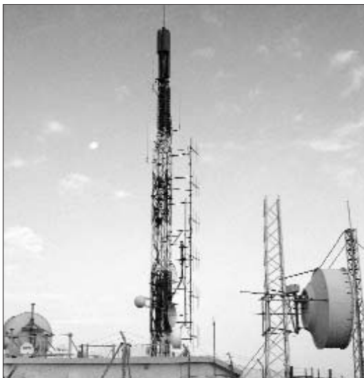
El repetidor de Perenxisa és l'únic que s'ha salvat de la segona onada d'expedients

El tancament d'Alginet i la Llosa són producte del segon i tercer expedient obert per la Generalitat valenciana. Concretament el mes de febrer d'enguany es va obrir un procés sancionador contra aquests dos reemissors i el repetidor de la Perenxisa - que dona cobertura a l'àrea metropolitana de València -. Així mateix s'interposava una multa de 300.000 euros que se sumava als 300.000 del primer expedient dels repetidors del Bartolo (Castelló), la Carrasqueta (Alacant) i Mondúver