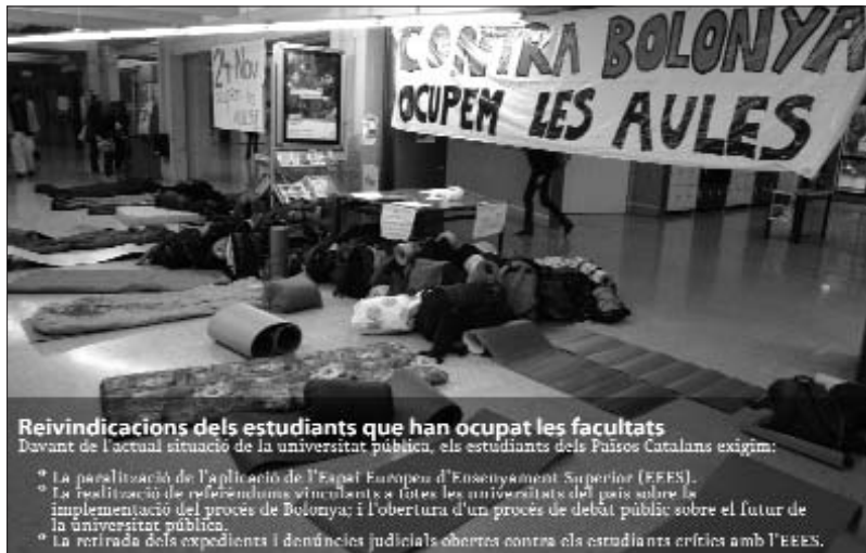
Reivindicacions dels estudiants que han ocupat les facultats

Des de l'inici de les tancades, els rectorats i els comitès universitaris contra Bolonya (formats per les assemblees de facultats i el Sindicat d'Es-