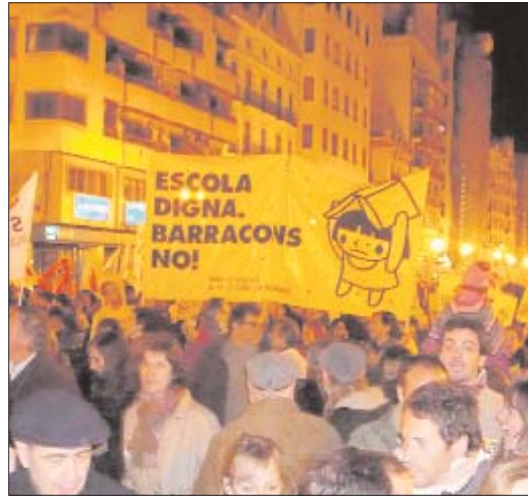
La manifestació superà les millors previsions

no obligatori es van sumar a la convocatòria l'Associació de Professors de les Escoles Oficials d'Idiomes (APEOICVA), la Unió de Cooperatives d'Ensenyament Valencianes (UCEV), estudiants i professorat dels conservatoris superiors de música, dansa i art dramàtic, sindicats de treballadores i treballadors i d'estudiants de la Universitat de València i Escoles d'Adults. A més, nombrosos col·lectius no vinculats al món de l'ensenyament van voler contribuir a la defensa del sector públic, des d'entitats culturals (ACPV) a molts dels denominats Salvem. I també els par-