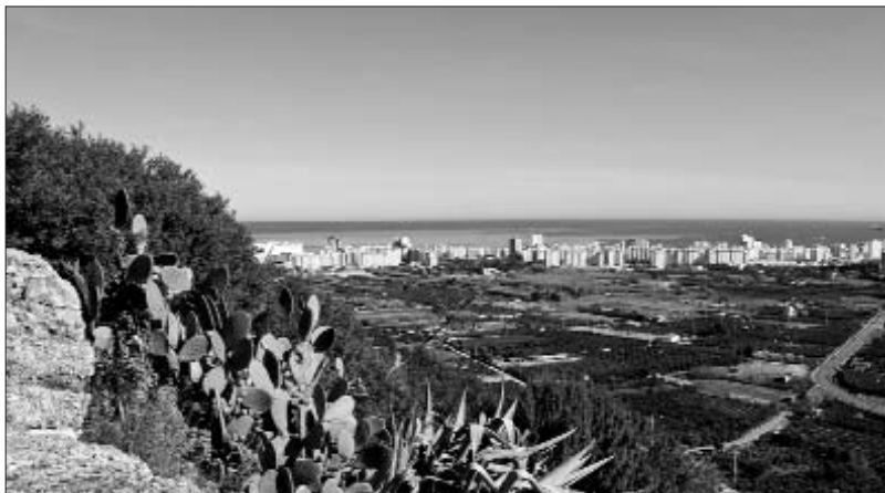
La primera línia de costa de la Safor ja està quasi tota construïda

De fet, com expliquen des del col·lectiu, el Pla Gandia 2025 és una megaprojecció molt lligada a la dinàmica política d'aquesta ciutat. La presentació del nou PGOU es va fer el passat 8 de maig al plenari municipal. Aquesta aprovació consumava un dels principals acords postelectorals de l'actual equip de govern municipal, on el PSPV es recolza en una escissió del Partit Popular. El líder d'aquesta escissió, Fernando Mut, des d'una regidoria que agrupa les àrees de Territori, Sostenibilitat i Habitatge controlarà el desenvolupament d'un Pla que pretén