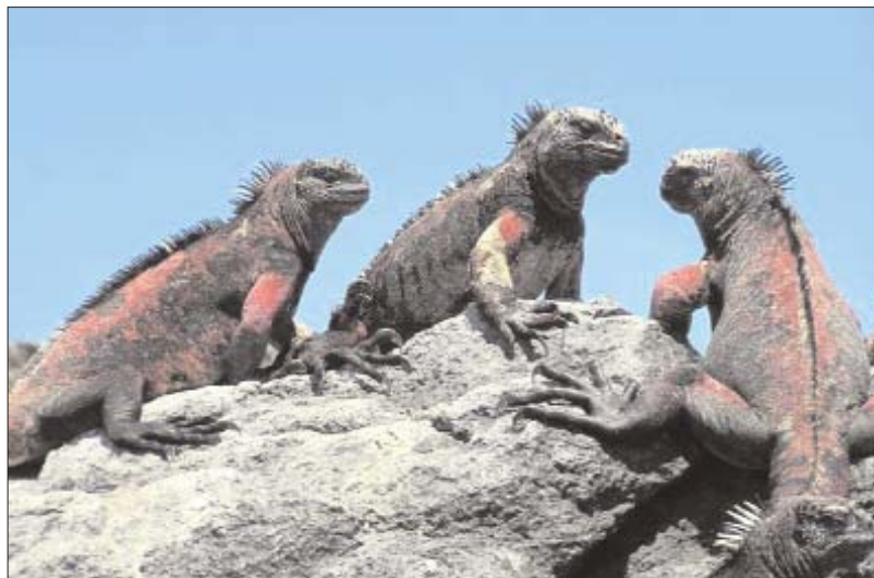
Iguanues marines a les Illes Galapagos

Al seu retorn, Darwin publicà detallats treballs de les seves observacions, fet que li feu guanyar una bona reputació científica, però fou extremadament prudent alhora de fer pública la teoria de l'evolució de les espècies, conscient de l'enorme rebuig que suscitaria entre els ambients religiosos. Al llarg de més de 20 anys anà acumulant dades i proves, examinant tots els aspectes de la història natural, per a consolidar la seva teoria, i no fou fins que Alfred Russel Wallace li escrigué explicant-