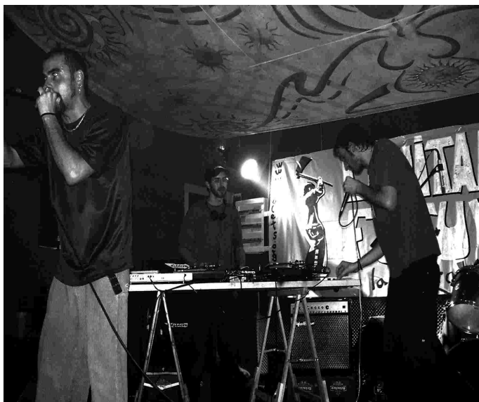
At-Versaris a la II Festa per la Independència de Maulets Mallorca

L'art és una expressió tan subjectiva i àmplia que hi hauria de tenir cabuda tothom. Però l'experiència ens recorda que sovint allò que hauria de semblar evident queda en quelcom llunyà, impossible, irreal. Així, trobem, per exemple, que des de la Generalitat del Principat es ret homenatge a la cultura únicament, i amb prou feines, col·locant sales i auditoris amb llurs noms com el d'Ovidi Montllor. Interpretem-ho des de la vessant pràctica: en quantes d'aquestes sales, l'Ovidi (i parlo de l'Ovidi perquè és el primer que m'ha vingut al cap), va poder actuar al Principat mentre va ser-hi en cos? En quantes d'aquestes sales va poder-se desenvolupar com a artista? I, el que és més important, per què volen fer seus aquests personatges que van ser totalment ignorats i marginats abans, durant i després d'aquella transició on ens intenten vendre, encara avui, que es van conquerir totes les llibertats possibles i més?