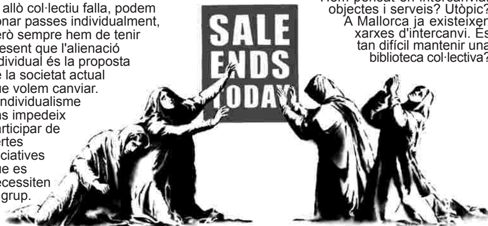
"Les rebaixes acaben avui" Banksy.

Si allò col·lectiu falla, podem donar passes individualment, però sempre hem de tenir present que l'alienació individual és la proposta de la societat actual que volem canviar. L'individualisme ens impedeix participar de certes iniciatives que es necessiten al grup.