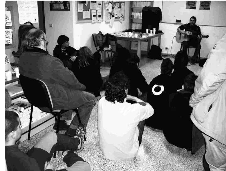
Cesk Freixas en un concert en la Diada de Mallorca

Fins que aquest context es mantingui amb la mateixa dinàmica, seguirem apostant per vies de treball i difusió paral·leles i desvinculades de les que ofereix l'escena oficial, de la mateixa manera que seguirem condemnant la criminalització, la censura i la manipulació que rebem i ens arriba des de l'àmbit merament institucional. Perquè quan les lleis ens són injustes i gens nostrades, cal utilitzar la ferma decisió de desobeir per construir una realitat justa, equitativa i igualitària.