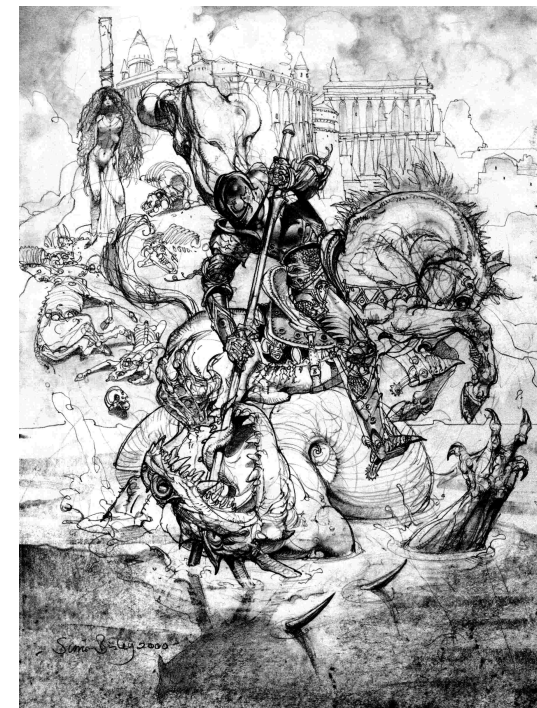
Sant Jordi matant el drac

Però el fet és que, en la nostra tradició, existeix aquesta visió cristiana. Així, als pobles de Mallorca aquesta celebració destaca per les processons que es realitzen: Dijous Sant, Divendres Sant (en què es representa el trasllat dels cos de Jesús a la seva tomba) i el Diumenge de Pasqua, en què té lloc la Processó de l'Encontre, que consisteix en la trobada de les imatges de Maria i Crist ressuscitat).