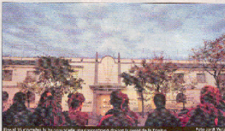
Final, 15 d'octubre hi ha convocada una concentració davant la presó de la Trinitat.

Una acció de suport espontània però va atorgar un moment nou maldecap. Un 98 va ser detingut la nit del 7 d'octubre al carrer de Sant per unes pintades en suarets empresonats. El jove