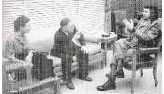
El "Che" en una reunió amb JP.Sartre, el qual visita la revolució.

obligacions com a membre del govern, s'aplica a consciència en l'estudi de l'economia marxista, així com de la capitalista, a més a més d'elevades lliçons de matemàtiques, per tal de fer quadrar el que serà el projecte més gran dut a terme per Ernesto: la socialització de tots els capitals de l'illa i la industrialització de l'economia.