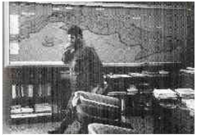
El "Che" al capdavant del Banc Nacional Cubà, a l'any 1960.

professionals especialitzats, importació de tecnologia i diversa maquinària industrial i bèlica... Inclús, i contra la voluntat de Guevara, l'URSS concedeix uns préstecs (a retornar naturalment) per al desenvolupament econòmic de Cuba. Guevara creu en l'ajuda mútua sense interesos entre els països que han traspassat la frontera del capitalisme i han entrat en el socialisme, on teòricament els països han superat l'afany de lucre i l'ajuda solidària als altres països és un deure moral, no una font d'exploació. Però la realitat era una altra, i a canvi de comprar la major part de la producció de sucre de l'illa, l'URSS va protegir els cubans de les urpes d'Estats Units (que van deixar de comprar a l'illa), i d'altra banda va intentar, sense èxit, instal·lar unes bases de míssil nuclears en territori cubà, l'anomenada crisi dels míssils, que va tindre en vetlla al món durant el breu litigi entre les dues superpotències, en la que semblava que el món acabaria destruït per un apocalipsi nuclear.