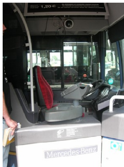
imagen y no recibir nada a cambio. Cuando la imagen es buena, punto para la empresa, cuando la imagen es mala...”full d’aclariments” al