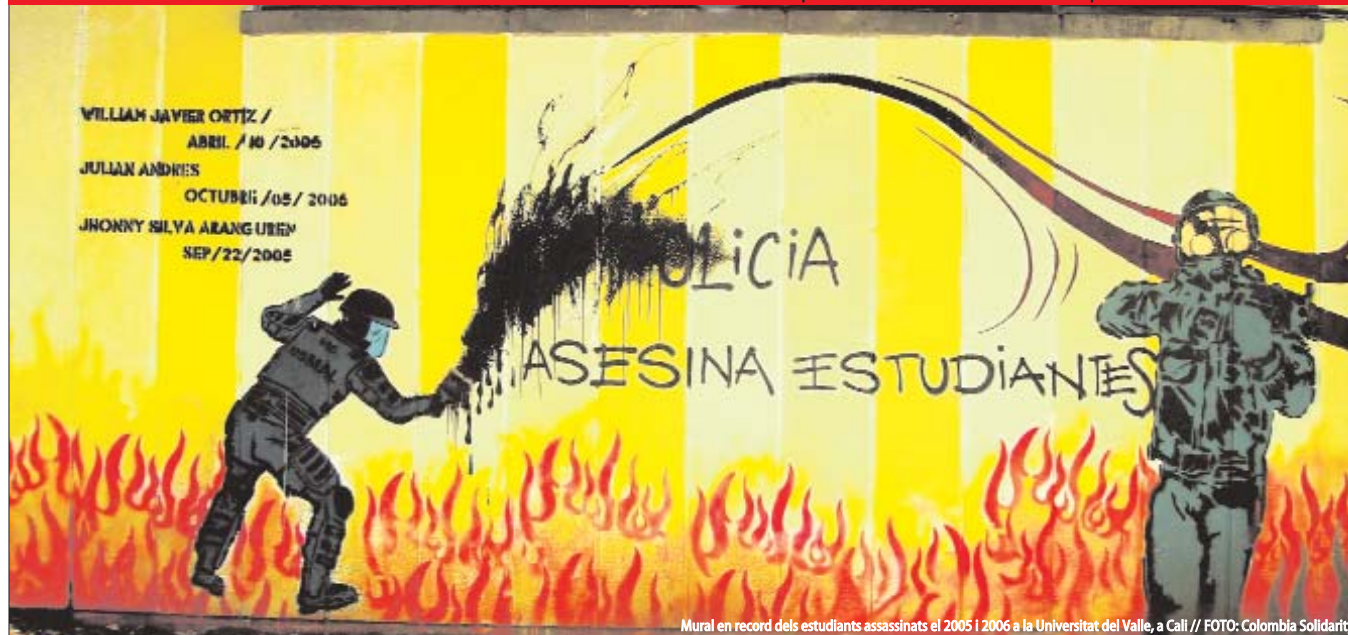
Mural en record dels estudiants assassinats el 2005 i 2006 a la Universitat del Valle, a Cali