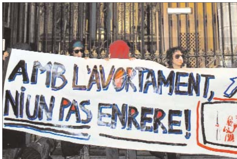
Tancament a l'Església de Pi de Barcelona per la despenalització de l'avortament