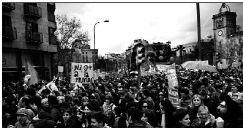
Manifestació en contra la Llei d'educació de Catalunya, el febrer de 2008