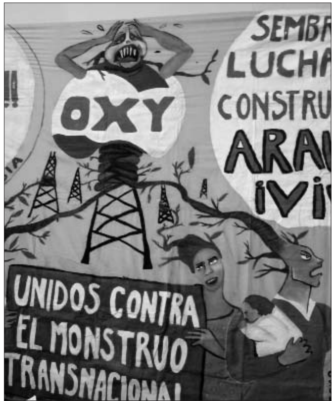
Mural contra les petroleres a Arauca

manipulació dels mitjans de comunicació, que desinformen sobre la relació del narcotràfic amb la família Uribe o de l'extradició dels 14 paramilitars amics del president que realitzen declaracions sobre les atrocitats que realitzaven contra els camperols