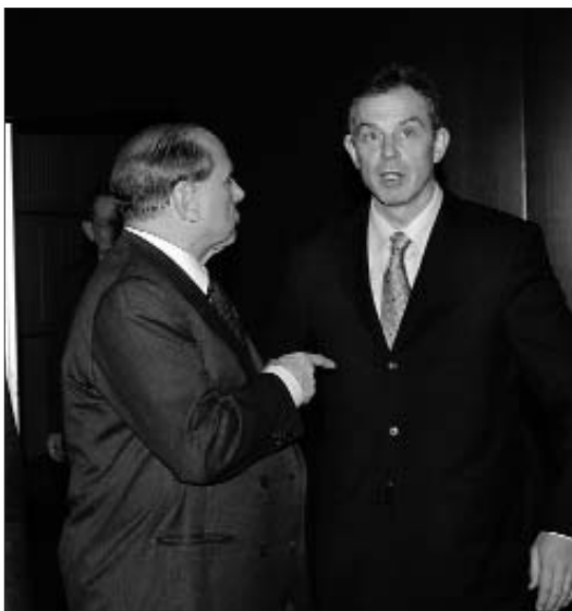
Silvio Berlusconi a una trobada de l'OTAN de la seua anterior legislatura

Tots els instituts de recerca s'afanyen a fer notar que des de fa uns anys el número de delictes a Itàlia està disminuint però ningú sembla escoltar-los: compte el suposat "sentiment d'inseguretat" ciutadana, molt alimentat pels mitjans complaents amb el poder, que repeteixen com automàtics els polítics de l'oposició i del Govern. I poc importa fer notar que a Itàlia una emergència en seguretat efectivament hi és, i és aquella relativa a les grans organitzacions criminals i als seus afers milionaris, del tràfic de deixalles al d'armes i droga: l'enemic és, hi ha de ser, el romanès, el marroquí, el gitano. La