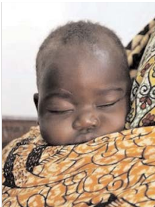
Un infant de Malawi infectat per la sida

Des de fa anys s'espera una vacuna per tal d'afrontar la malaltia, però aquesta sembla que mai no arribarà. Els medicaments existents actualment tenen la finalitat de fer que el malalt pugui viure en millors condicions, però no tothom té el