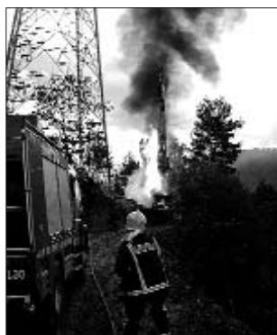
Maquinària cremat a les obres de la MAT

L'aturada parcial demostraria segons Mucnick "que els opositors tenien raó ja que -independentment de la necessitat o no de la línia- s'ha demostrat que el traçat s'ha fet des d'un despatx sense ni tant sols trepitjar el territori". Així mateix, afegeix que malgrat la instal·lació de les primeres obres continuaran treballant per aturar la MAT. En aquest sentit, assenyala l'exemple aragonès on encara es poden observar algunes de les torres de la interconnexió elèctrica fallida.