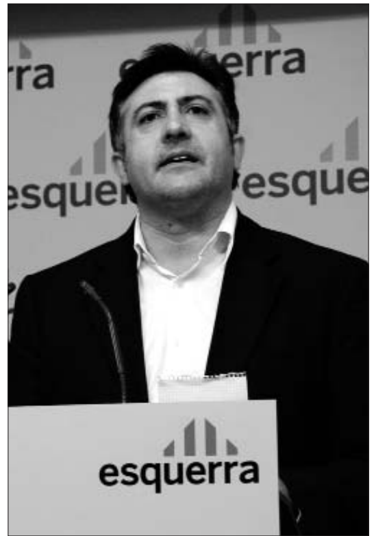
No hi ha hagut sorpresa i Puigcercós s'ha proclamat vencedor