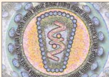
El virus VIH

temps a la disposició del públic. Fets com aquests es plasmaven, l'any 2005, en la pel·lícula El jardiner fidel , basada en fets reals, on es narra un succés que va ocórrer a Nigèria, amb la companyia Abbot (processada actualment).