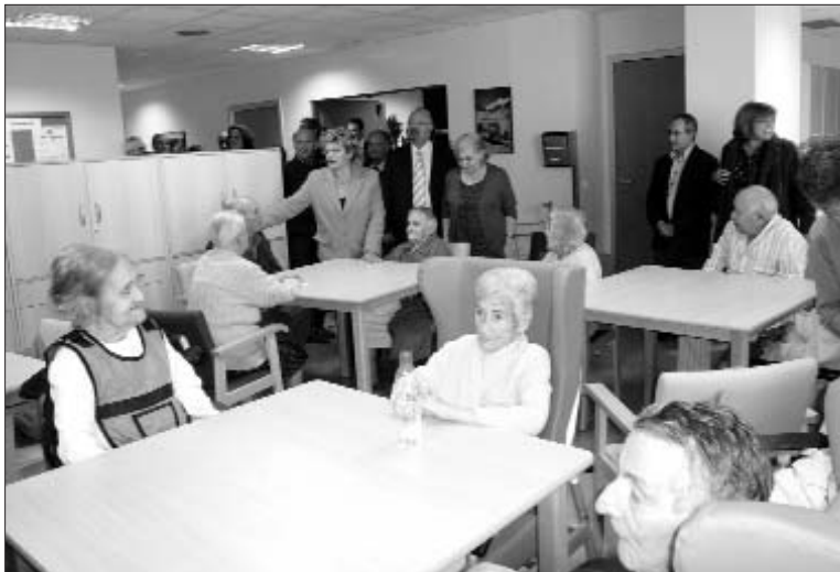
Els pensionistes temen perdre més poder adquisitiu

El Ministeri de Treball, cartera que actualment ostenta l'antic alcalde d'Hospitalet, Celestino Corbacho, ja està preparant l'Informe de reforma, que s'espera passi per les Corts espanyoles al març o abril de 2009.