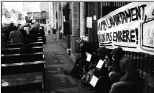
Encadenades a l'Església del Pi

Totes les organitzacions feministes que participen en la campanya autoinculpatòria per l'avortament lliure i gratuït lluiten per aconseguir el reconeixement de l'avortament com un dret que es pugui aplicar simplement per decisió de la dona i sense els elevats costos econòmics que acostuma a suposar avui en dia. Aquest fet ha de passar obligatòriament per treure l'avortament del codi penal i suposaria també que l'avortament fos practicat dins a xarxa sanitària pública de forma normalitzada. La campanya també reclama la fi de les detencions i processaments per avortament, la desaparició immediata de totes les responsabilitats penals que s'han produït i que acabi la "hipocresia i manipulació de la dreta i l'esglé-