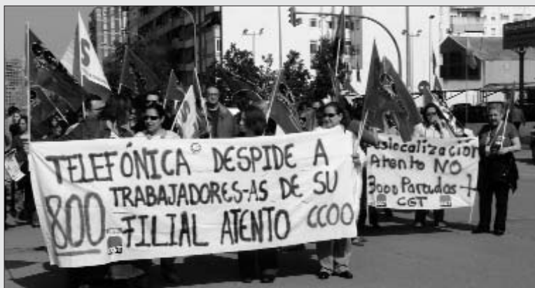
Protestes pels acomiadaments de la filial de Telefónica a València, l'any passat