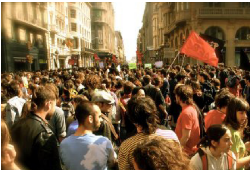
Manifestació a Barcelona contra la LEC i el procés de Bolonya

veu als òrgans de poder de l'educació universitària com en el consell social amb les seves inversions en les carreres que li siguin més convenients, d'aquesta manera podent imposar els seus criteris amb l'objectiu de treure profit dels "productes graduats" tal i com s'enfocaria des d'una perspectiva empresarial.