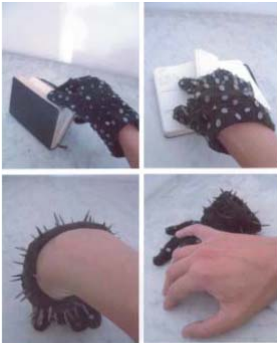
↳ Protecció Guants de feltre amb gavarots 3,5 cm x 10 cm x 22 cm ANY DE REALITZACIÓ: gener 2004