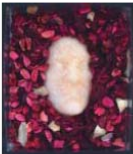
↳ No tengo miedo 1, No tengo miedo 2, No tengo miedo 3... tècnica: instal·lació composta per tres peces: .. Caixa d'acetat de 32 cm x 27 cm x 6 cm, perfil de cera i flors seques .. Panell fotogràfic de 105 cm x 60 cm .. Panell de màscares de 24 cm x 70 cm x 15 cm. De fusta, casquets de bales de 9 mm, guix i cera. ANY DE REALITZACIÓ: 2004