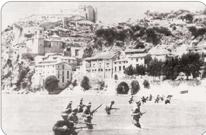
Imatge de la Batalla de l'Ebre, l'any 1938

El 30 d'octubre s'inicia la contraofensiva definitiva, a meitat de novembre Flix, la Fatarella i Ribarroja cauen en mans feixistes i uns dies després les tropes republicanes es repleguen a l'interior del Principat, víctimes de les dificultats de sempre: manca de reserves militars organitzades i gran inferioritat en armament, sobretot aviació, tancs i artilleria.