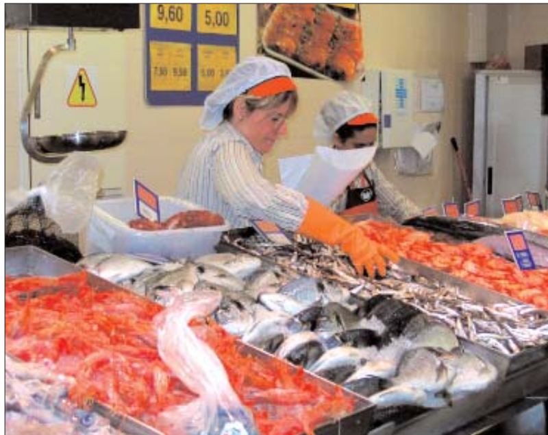
En la gran majoria de llars dels Països Catalans només les dones han apostat per fer realitat la conciliació laboral

La distribució per comunitats autònomes no mostra cap diferència territorial en aquest sentit, ja que el 98,26% de les prestacions de maternitat a les Illes va correspondre exclusivament a la mare, el 98,49% al Principat i el 98,94 al País Valencià.