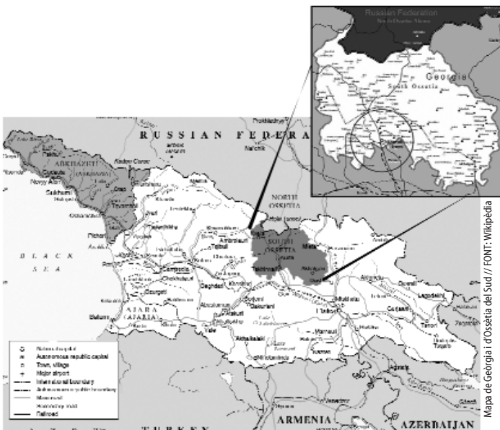
Mapa de Geòrgia i d'Ossètia del Sud