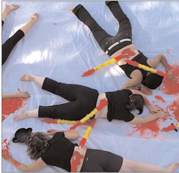
Acció durant una mobilització antitaurina a Inca el passat 22 d'agost

A Palma, per segon any, Maulets realitza una campanya amb dos eixos: declarar Palma ciutat antitaurina i aturar la colonització cultural que porta aquesta "tortura