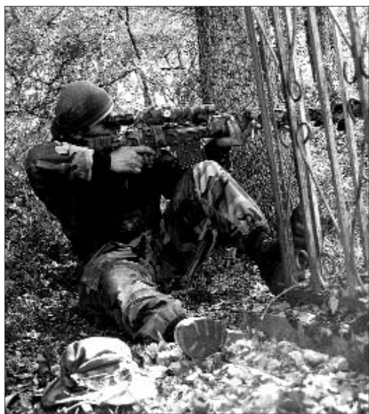
Soldat georgià durant el conflicte

segur, significarà un punt d'inflexió, no únicament a nivell regional sinó, i sobretot, en la tensió existent entre l'unipolarisme atlantista, encapçalat pels Estats Units, i les diverses i noves potències regionals, en aquest cas la Federació russa, a l'hora de configurar un nou ordre de relacions internacionals.