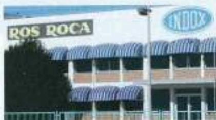
S'ha aconseguit un comprador que s'ha quedat tots els actius de l'empresa

CCOO de Lleida i la Federació d'Indústria del sindicat han treballat per aconseguir trobar un comprador per a l'antiga Indox que fos afí als interessos dels treballadors i treballadores. El sindicat va demanar al jutge que prioritzés els compradors que estiguessin interessats en tots els actius de l'empresa perquè això implicava salvar llocs de treball i no desmantellar la fàbrica.