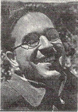
Mestre en la azotea de una casa de la CNT-FAI. 1937

mil lectores de una manera permanente había. Los sindicatos de la CNT como máximo llegamos a tener cuatro mil o cinco mil gentes. La UGT, socialista, tenía doscientos o trescientos; eran gente más bien moderada ..., pero gente que leía."